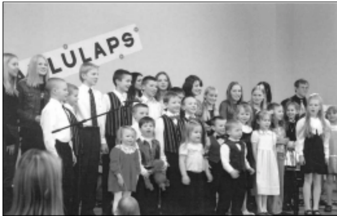
Kontserdi lõpus said solistid ka ühisesinemisest rõõmu.

Seejärel astusid lavale juba Saue linna oma väikesed staarid. Alustasid kõige väiksemad mudilased (3-a). Nende esinemine oli kahtlemata üllatus kogu publikule. Kui julgelt astuti lavale ja esitati oma laul! Pisikestele mudilastele järgnesid juba hoogsas tempos ülejäänud vanusegruppide lauljad. Tore oli see, et laulud olid väga