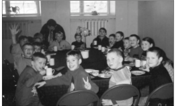
Külalised kringlit maitsmas.