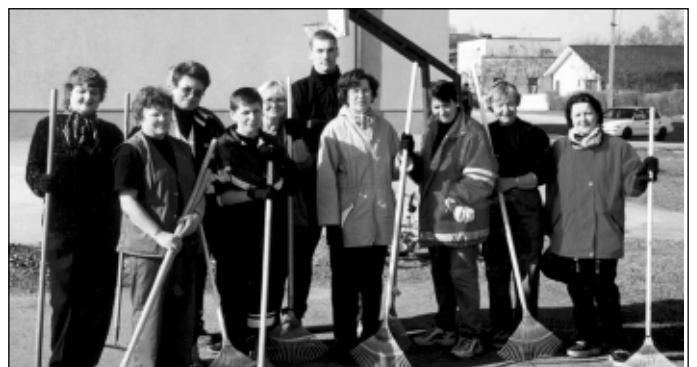
Ühe pildi peale satutakse harva.