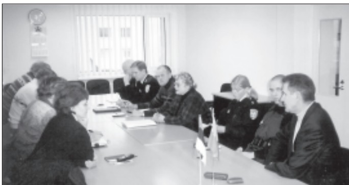
Esimesel nõupidamisel otsustati esmalt kaardistada Saue tegelik olukord erinevates valdkondades.

Rahvasuu väidab, et kui probleemi ei taheta lahendada, siis tuleb selleks komisjon teha. Korrakaitse komisjoni puhul on probleem teisiti asetatud – kui soovime Saue turvalisust ja korda säilitada, tuleb teha seda ühiste jõududega. Nimelt ongi korrakaitsekomisjoni eesmärgiks koostöös korraldamine erinevate asutuste, ametite, erettevõtete ja vabatahtlikega Saue linnas. Komisjoni tegevusvaldkondadeks on avalik kord, korrakaitse ja elanikkonna turvalisus, samuti liiklusohutus, alaealiste järelvalve ning nende poolt õigusrikkumised. Omaette valdkond on koostöö turva-, tuletõrje- ja päästestruktuuride, politsei ning kaitseliidu vahel ning seejuures elanikkonna kaasamine turvalisuse ja õiguskorra tagamisele. Siinkohal on mõistlik öelda, et Falcki turvamehed ja mitmed Kaitseliidu liikmed on saamas abipolitseiniku kvalifikatsiooni. See võimaldab neil paremini korrarikumisi takistada, sest neile laienevad mitmed politseinike õigused. Komisjoni vaateväljas on uute naabrivalve sektorite moodustamine ja kindlasti ennetustegevus.