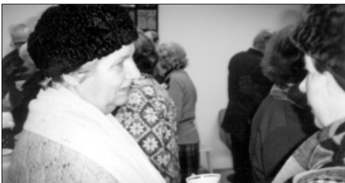
Pensionärid mõttevahetuses pärast kohtumist linnapeaga.