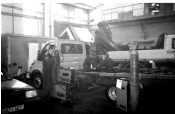
Firma suures tootmishoones käib töö korraga mitme eriotstarbelise veoki kallal.

Kõige tüüpilisem on rungale ehk siis vaid kabiini ja käiguosaga autole mingi eriotstarbega seadme paigaldamine. Näiteks firma külastamise ajal ehitati ASile Signaal madelkastiga veokit, mille varustusse kuulub veel veovints ja hüdrauliline tõstukraana. Kunda sadamat teenindava firma tarbeks oli töös 13 m3 mahuga vaakumsisterniga pilsi-vete veok. Elektrivõrkudele aga valmis samal ajal Itaalia päritoluga Ferrari firma kraanat-tõstetorkorvi kandev eritööde veok. Samas ei ole FERRARI kraanasid valmistav firma kuidagi seotud vormel 1 maailmast tuntud võidusõidu autoga ega samanimelise eksklusiivse sõiduautoga. Pajundi sõnul on Ferrari Itaalias sama tihti esinev nimi nagu venelastel Ivanov. Mõõduvõrd aastast mindigi üle vaid Itaalias valmistatud hüdrauliliste seadmete, vintside ja tõstevahendite kasutamisele. Pajundi lisas, et firma ei võistle standardautode tootjatega, sest viimaste toode on tänu suurtele seeriatele alati odavam. EuroKraft on arendanud välja oma tugeva külje, milleks on erinevate seadmete ja osade täpne hankeplaan. Kliendile korraliku veoki valmistamiseks vajalikud tooted ostetakse sisse ja paigaldatakse täpselt kokkulepitud tähtajaks. Väljastatud veoki pealisehitusele antakse aastane garantii, mille jooksul kliendil lahus kohustus teostada EuroKraftis kolm täishooldust. Täishooldused kindlustavad pealisehituse edaspidise tõrgeteta töö.