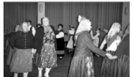
Meeleoluka peoõhtu lõpetas Kihnu naiste ühistants sauelastega.