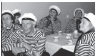
Saue eakate võimlemisrühma liikmed on kehastunud meremeesteks.

Alates 1982 aastast tähistatakse 29. aprillil kogu maailmas UNESCO Rahvusvahelise Tantsunõukogu CID ettevõtmisel tantsupäeva. Tänavu olid tantsuhuvilised hiljuti renoveeritud kultuurikeskusesse Kaja Mustamäel. Tantsurahvast kogunes mitusada ja seda väikestest tantsuõpradest eakateni. Erinevatel aastatel on Eesti Rahvatantsu ja Rahvamuusika Selts pakkunud oma liikmetele võimalusi tantsupäeva tähistamiseks. Küll on tantsitud Raekoja platsil ja Viru tänaval Tallinnas, Lindakivi Kultuurikeskuses Lasnamäel ja mujalgi. Tantsupäeva peamine eesmärk on tõmmata tantsule avalikkuse laiemat tähelepanu.