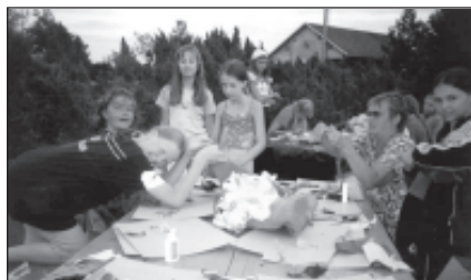
Meenutus eelmise aasta kunstilaagrist Pivarootsis.