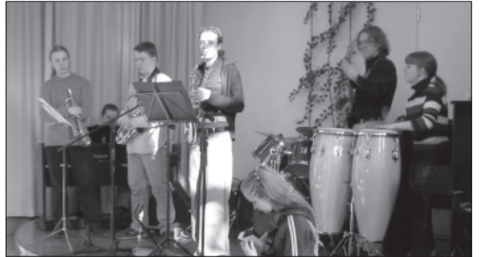
Ansambel Jazz Beats oma hooga esiemise lõpul Pelgulinna Rahvamajas.