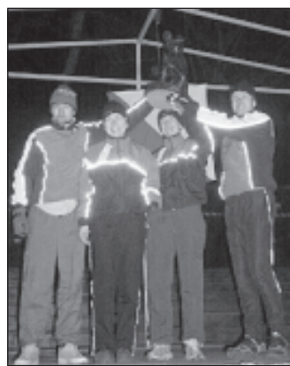
SK Saue Tammed I võidukas võistkond pärast Jüriööjooksu võitmist Kuressaares.

Jüriööjooks on Eesti orienteerumise üks tähtsündmusi ja kevadhooaja värvikaim üritus. Viieliikmelises võistkonnas jooksevad vaheldumisi kolm meest ja kaks