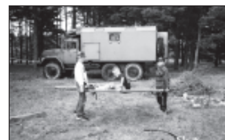
Poisid laagris toimetamas.

Esimesel päeval omandati eri- nevat tündides kõiki vajalikke teadmisi, et metsas hakkama saa- da. Hiljem aga korraldati aja pea- le erinevaid jõukatsumisi. Näiteks tuli läbida rada, kus oli tarvis telk üles panna, kambas kummipaati vedada, jalgpalliga takistusriba lä- bida jne. Eraldi oli võistlus õhu- püssist täpsuslaskmise peale.