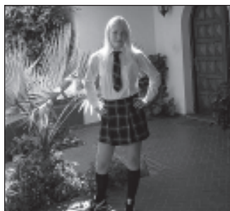
Mina ja mu koolivorm.

Elan linnas nimega Salta mis kuulub Argentiina põhjaregiooni. Salta provintsi, mis katab 154 000 ruutkilomeetrit, asub Boliivia piiri ääres. Kuhugi kaugemale polegi veel jõudnud, esmaspäeval lähen arvatavasti väikesele reisile ümbruskonnas, siis ehk näen rohkem. Salta linna ümbritsevad igast kandist väikesed mäed (cerros), mis on eriti ilusad hommikuti, kui päike hakkab tõusma ja alguses ainult neile peale paistab.