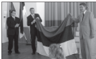
Peaminister kinkis Sauele lipu.