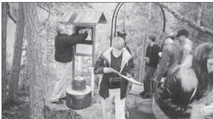
Saue ja Helsingi õpilased tegid koos loodusvaatlusi.

... äratus kell 7.00 ja 9.00 asusime teele Raasepori kindluslossi. Ka sellega suutsid soomlased meid üllatada, sest nii vanu ja ajaloolisi ehitisi on Soomes ju vähe. Ehitusmaterjaliks oli loomulikult graniit ja oma soodsas asendis tõttu on lossi pärast mitmeid lahinguid peetud. Ühiselt tehtud, võtsime jões veeproovid, et võrrelda neid Vantaa jõe veeproovidega. Siis algas sõit Inkoo soojuselektrijaama, mis asub Fagerviki lahe ääres ja on Põhjamaade suurim kivisõe baasil töötav elektrijaam. Täiesti puhas ümbrus, muru niidetud, lilled - tundus uskumatu, et tegemist on tööstustevõt-