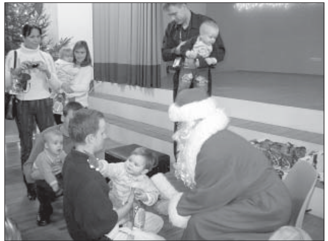
Saue lapsed suhtusid jõuvanasse ilmse sümfaatiga ja suhtlesid ka omavahel vabalt.

Pärast kingituse saamist, milleks oli sel aastal kommikott ja riidest päkapikk, oli võimalik koos jõuluvanaga pilti teha. Paljud lapsed olid üritusele kaasa võtnud lisaks vanematele ka vanemad õed-vennad ja vanavanemad. Pärast etendust oli võimalik uudistada koolimaja fuajees keeraamikaringi savitoidid ja lillesaeringi jõulupä-