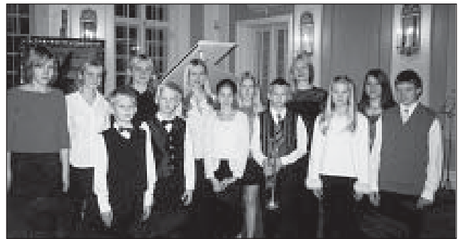
Saue Muusikakooli aastalõpu kontserdil esinenud õpilased.