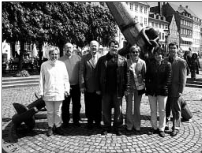
Saue delegatsioon rõõmsalt seismas Taani reisi ajal Kopenhaageniis.

Kui nüüd arvesse võtta, et Ledøje-Smørum'i 2004 aasta eelarve on u 1,2 miljardit Eesti krooni, siis tundub see esialgu utoopiliselt suur summa. Ja ongi. Arvestades, et neil on 2 korda rohkem inimesi kui meil, siis oleksime meie rahvaarvu võrdseks loendamisel ikka 8,57