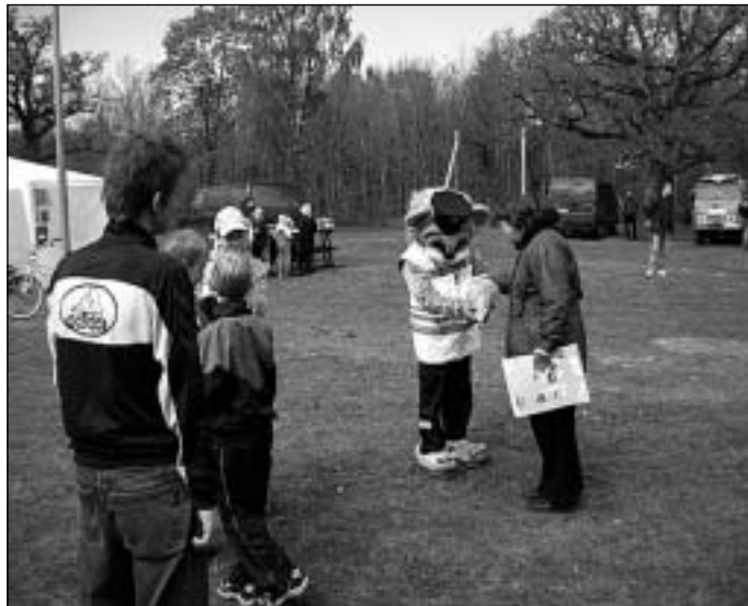
TurvaVesti platsil oli palju turvatehnikat, palju osalisi ja palju asjast huvitatud lapsi.

Kõik kohaletulnud üksused said end läbi Kirill Teiteri intervjuu suusõnalistelt tutvustada. Samas oli võimalik tutvuda ohutust tagavate materjalide, vahendite ja autodega. Kohal oli Tallinna Tuletõrje ja Päästeameti Lilleküla komando 54meetrine tõstuk, Keila komando redel-auto ning Mati Leivategija uunikum-tuletõrjeauto. Maanteeameti kalendri kaudu võisid lapsed ja noored kinnitada õpitu. Osaleda sai oskusi ja kogemusi pakkuvates ülesannetes: joonistada, pulberkustutiga tuld tõrjuda ja autostendil vastu seina sõita. MTÜ Banaanikala esitas haarava etenduse "112 aitab", mille käigus lapsed nägid hädaabinumbri vale-