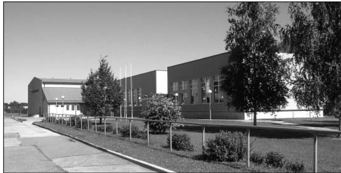
Saue koolimaja on suvega saanud värskendust

Tehes kokkuvõtteid eelmisest kooliaastast, võivad meie kooli õpeta-