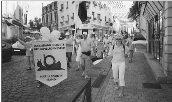
Harjumaa Noorte Puhkpilliorkester tutvustamas ennast Prantsusmaa väikelinna Confolense'i tänavail

Juhuse tahtel otsustasid CIOFFi tugeval toetusel rahvusvahelist kultuuripärandid tutvustava muusika- ja tantsufestivali korraldajad kutsuda puhkpillimuusikat esindama orkestri Eestist. Kuna HNPO oli selle aasta alguses kuulutatud Eesti Koorühingu ekspertkõitluse alusel aasta parimaks puhkpilliorkestriks, saab loogiliseks pidada CIOFFi Eesti esinduse ettepanekut, osaleda festivalil rahvuskultuuri meepoolse esindajana. Festivali korraldajad töid kokku kirju seltskonna, mis esindas viitteist rahvust kõigilt kontinentidelt. Olgu siin nimetatud eksootilisemad paigad: Armeenia, Boliivia, Burjaatia, Tšiili, Kolumbia, Guatemala, Kosovo, Paapua Uus-Ginea, Quebec, Tšehhi, Martinique, Senegal, Šveits. Selline esindatus muutis keskaegse kitsaste tänavatega väikelinna tõeliseks rahvaste paabeliks, kus päeval toimusid kolmekümnekraadises kuumuses karnevalile sarnanevad rongkäigud ja õhtuti kaleidoskoopilised kontserdid. HNPO oli seejuures festivali kõige põhjapoolsem esindaja.