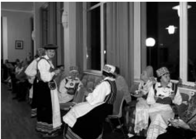
Pärast etteasteid lükati toolid seinte äärde, joodi ringli kõrval kohvi ja siis ootaski tantsupõrand.