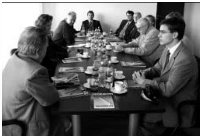
Sauekad kohtuvad Vangaži ettevõtjatega.