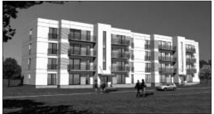
Sellised näevad tulevikus välja arhitekt Kalle Rõõmuse poolt kavandatud korterelamus Sauel.

Veel mõned märkused majade kohta. Kahes elamus on mõlemas 11 korterit ning kahes elamus mõlemas 15 korterit. Korterite hind on kalkuleeritud 755 000 – 1 095 000 krooni sõltuvalt korrusest ja tubade arvust, seega tuleb ruutmeetri hinnaks 13 827 – 15 467 kr/m 2 . Kokku on kruntide suurus 4685 m 2 ja ehitatavates neljas majas tuleb elamispinda kokku 3370 m 2 . Kinnisvara arendaja ja müüja on Arco Investeeringute AS / Arco Vara Tallinna büroo AS, mille kohta lisainfot saab vaadata www.arcovara.ee/saue või saata oma päri-