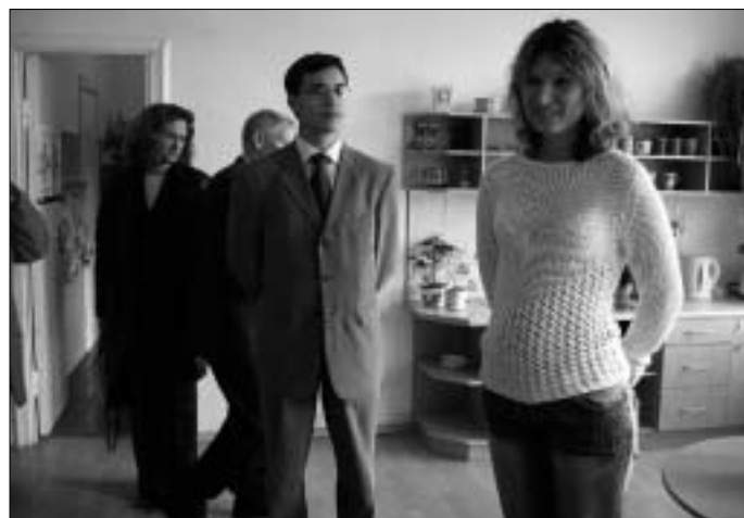
Vangaži lasteaed on Riia ümbruse edukaim.

Teine valdkond, millega sauelased tutvusid, oli ettevõtlus. Osa delegatsioonist külastas Vangaži suurimat tööandjat – torude ja metallkonstruktsioonide tootjat Izotermi. Ettevõtte on hõlmanud gigantse nõukogudeaegsete ehitusmaterjalide tööstuse hooneid mõned, sisustanud need oma vajaduste järgi, ühendanud raudteega ning annab toodangut 11 miljoni dollari eest aastas. Izotermis käisid sauelastega kohtumas ka ehitusblokkide ja puithoonete tootjate esindajad. Saue Ettevõtjate Liidu raamat meie ettevõtete tegevusalade ja kontaktandmetega jõuab teistegi Vangaži äriemeesteni ja kui kellelgi koostöömõtte tekib, saab seda