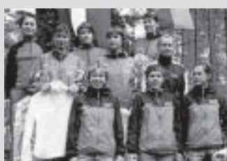
Saue Tammede võidukas naiskond (poodiumi ülemisel astmel)

individuaalses viiendad kohad – pole pahad. Tegelikult oli kolm naiskonda, kes konkureerisid – Kape, Ilves ja Tammed. Kape andis juba esimesel päeval alla. Võrdne võistkond on ka Kobras. Et edumaa iga päevaga kasvas ja lõpuks võit tuli, näitas, et meie naised olid eelkõige psüühiliselt tugevamad.