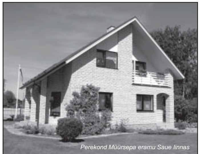
Perekond Mürsepa eramu Saue linnas

Konkursile ei esitanud ühtegi objekti Loksa linn, Aegviidu, Harku, Kõue, Loksa ja Viimsi vald.