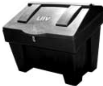
liivatamiskast, 300 L