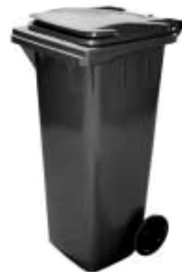
eramule, 140 L

AS Rotoplast, Tule 17, Saue, tel 651 7610, e-mail: rotoplast@rotos.ee