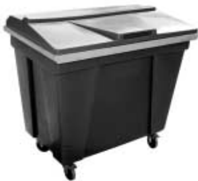
kortermajale, 800 L

Lisainfo, laiem valik ja hinnakiri: www.rotos.ee