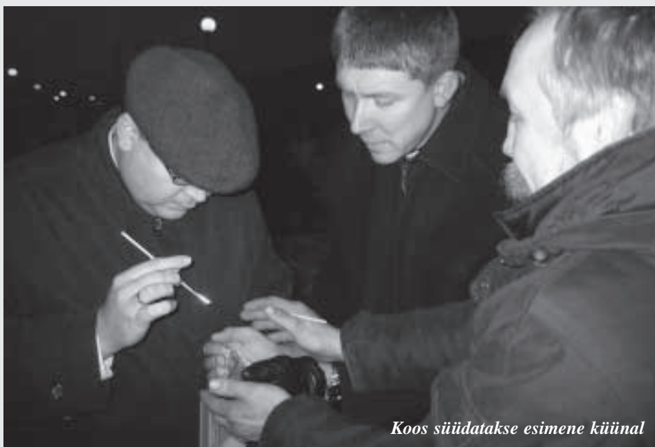
Koos süüdatakse esimene küünel

On traditsiooniks saanud, et jõuluaja alguse tähistamiseks saadakse kokku linna jõulukuuse juures.