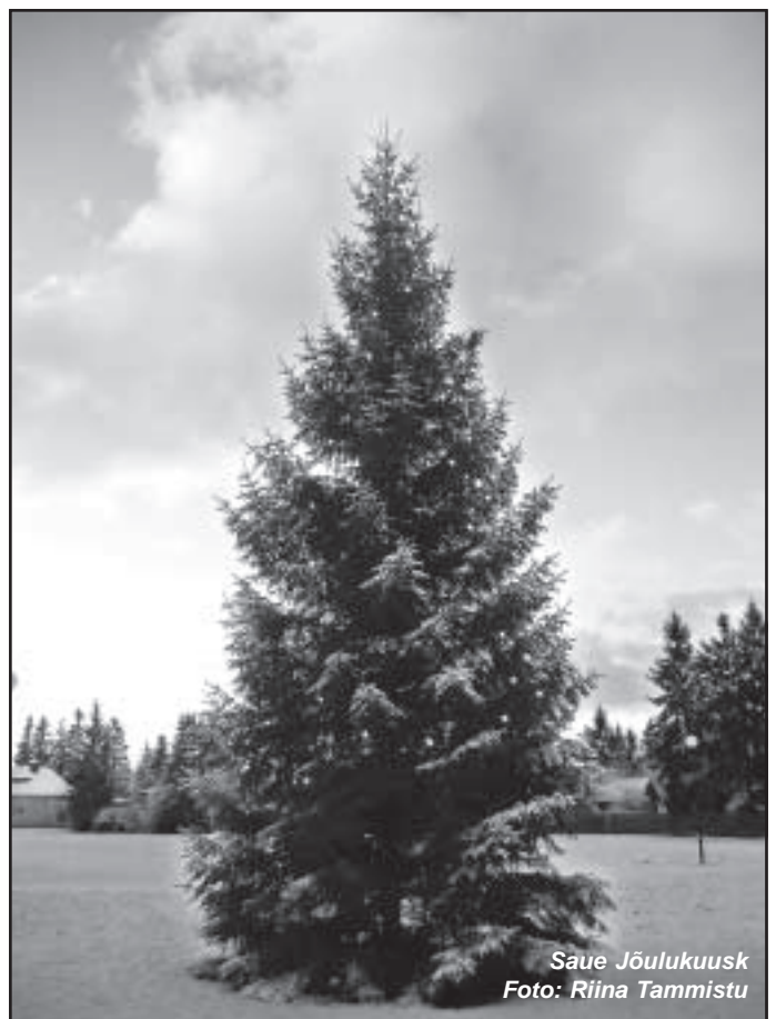
Saue Jõulukuusk

Õnnistatud jõulupühi kõigile Saue elanikele soovivad kogudus ja pastor Vahur Utno.