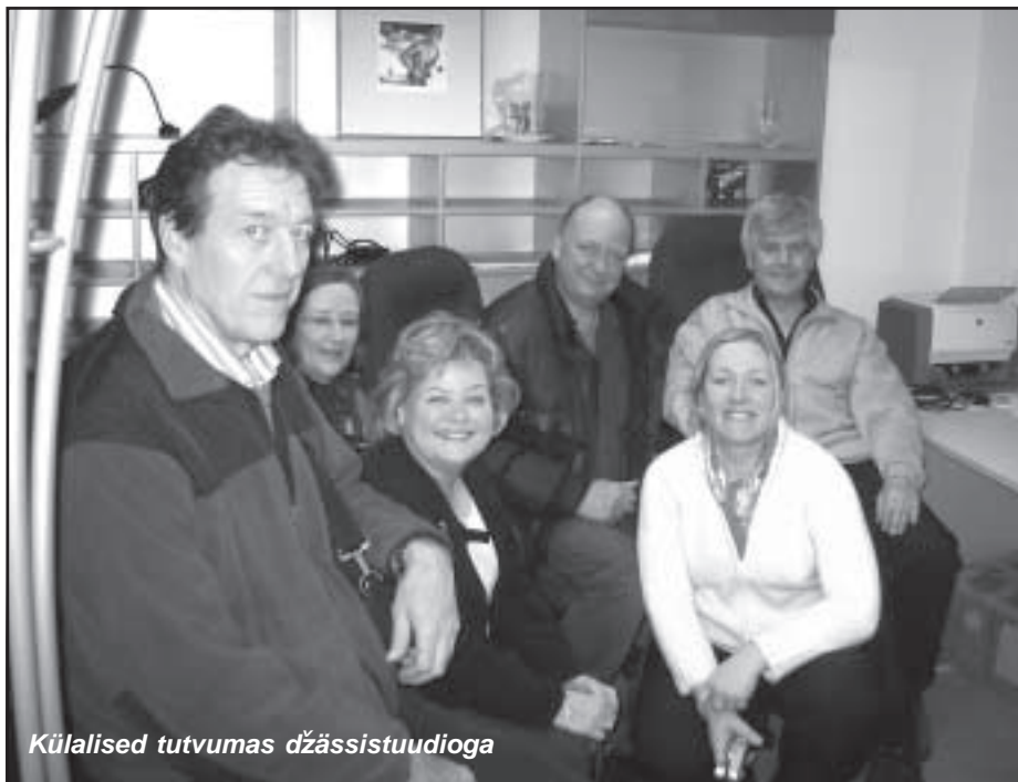
Külalised tutvumas džässistuudioga

Samuti peeti maha üks tõsine töökoosolek, kus arutati muusikakoolide vahelisi edaspidiseid koostöövõimalusi. Juunikuus toimuvale improvisatsioonifestivalile „Visioon“, tuleb work-shopi tegema üks Ledøje-Smørumi Muusikakooli õpetaja, sügise poole loodavad taanlased aga meie abiga käima saada koorilaulu tunnid, mis neil hetkel varjusurmas on. Järgmisel aastal aga plaanitakse koostöös välja anda Saue Muusikakooli Džässistuudios salvestatav plaat.