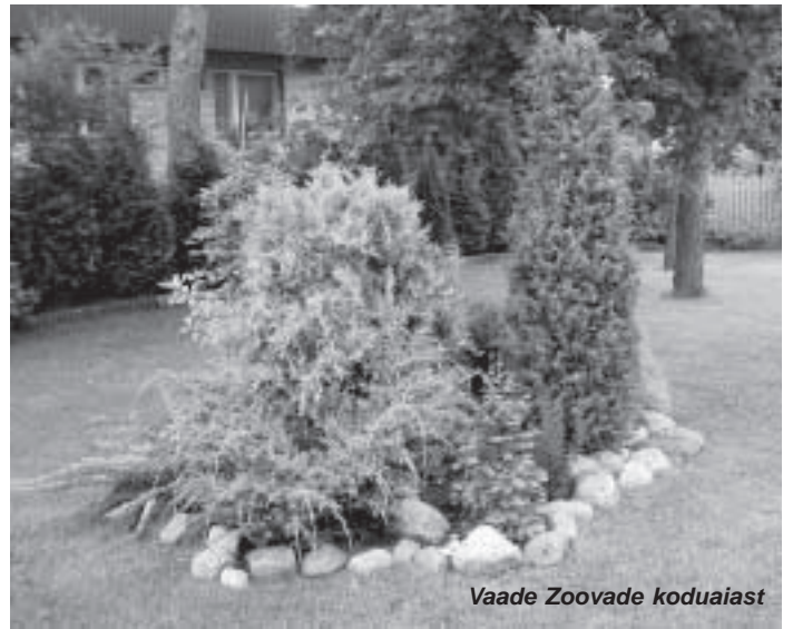
Vaade Zoovade koduaiast

Lõpetuseks kutsun inimesi üles mõistmisele. Kuna kõiki tublisid korraga tunnustada pole võimalik, siis tehakse seda