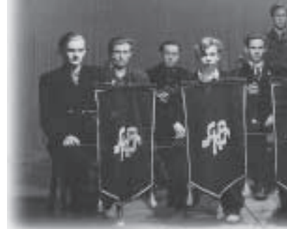
Abja Keskkooli estraadiorkester