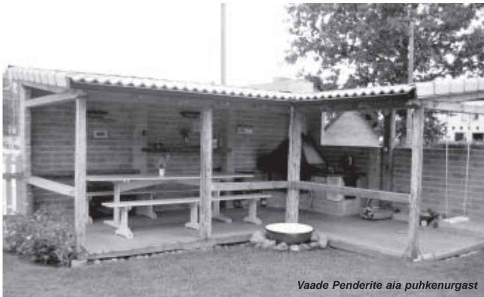
Vaade Penderite aia puhkenurgast