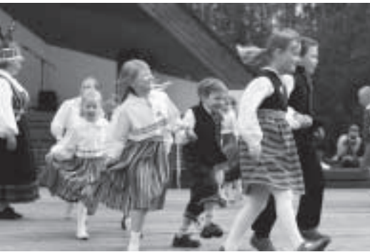
Saue erinevatest kollektiividest - Saue lasteaija ja Gümnaasiumi rahvatantsijad,