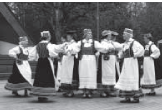
Saue Gümnaasiumi Väikeste tüdrukute koor, Saue Gümnaasiumi Noortekoor, Saue Puhkpilliorkester, Saue Poistekoor, Saue Simmajad, Saue Kägara kapell ja rahvatantsijad, ansambel Vokiratas ja naisansambel Rukkilill.