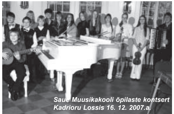
Saue Muusikakooli õpilaste kontsert Kadrioru Lossis 16. 12. 2007.a.