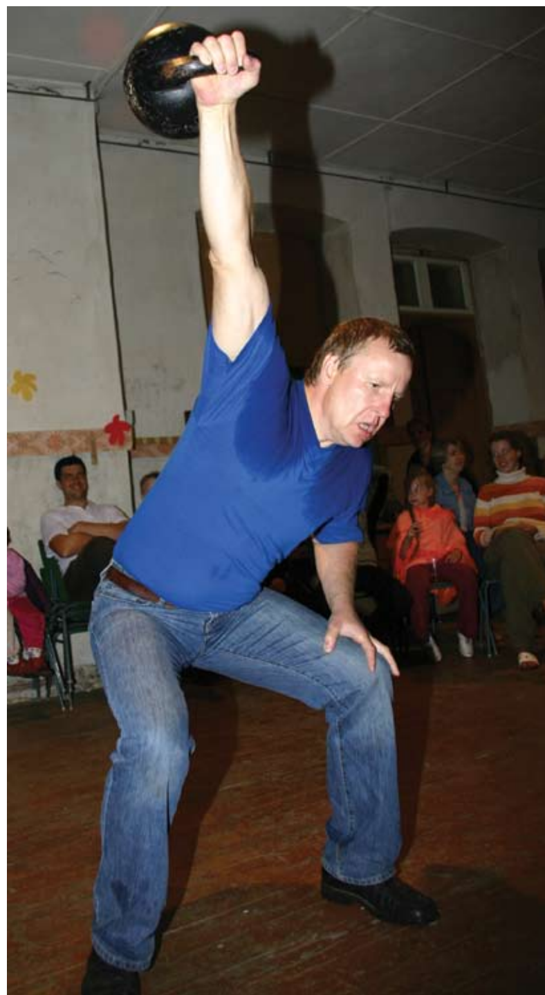
Selle mehega ei tasu tüli norima minna - Hüüru rammumees.