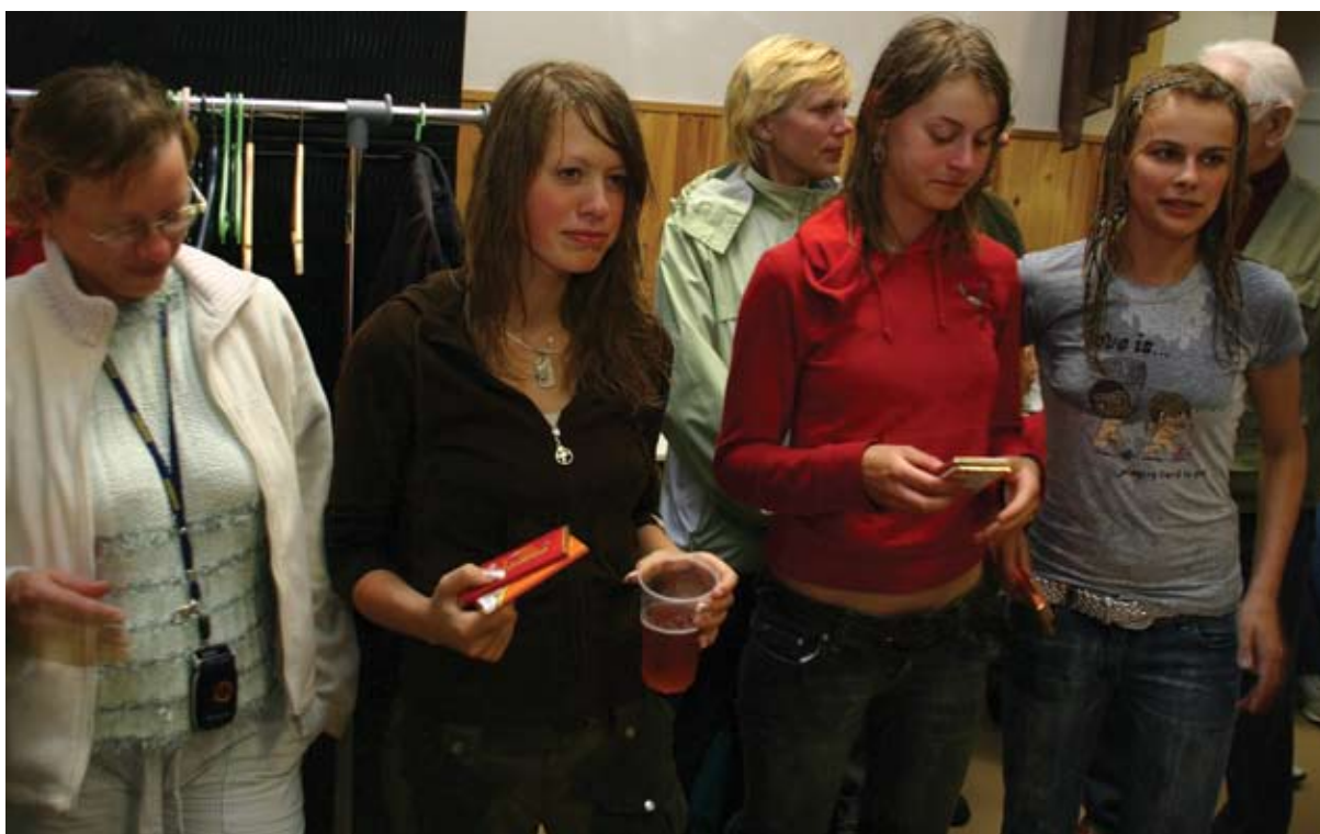
Targemad, ilusamad ja osavamad said ka premeeritud - tänu toetajatele!