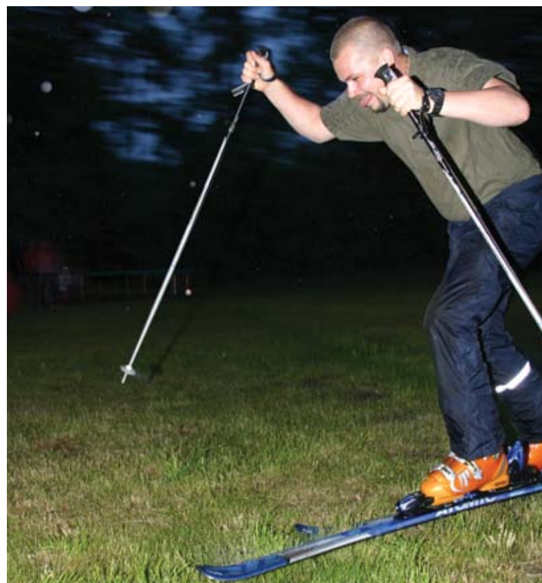
Tõeline suusasõber ei jää suvel pea norus talve ootama.