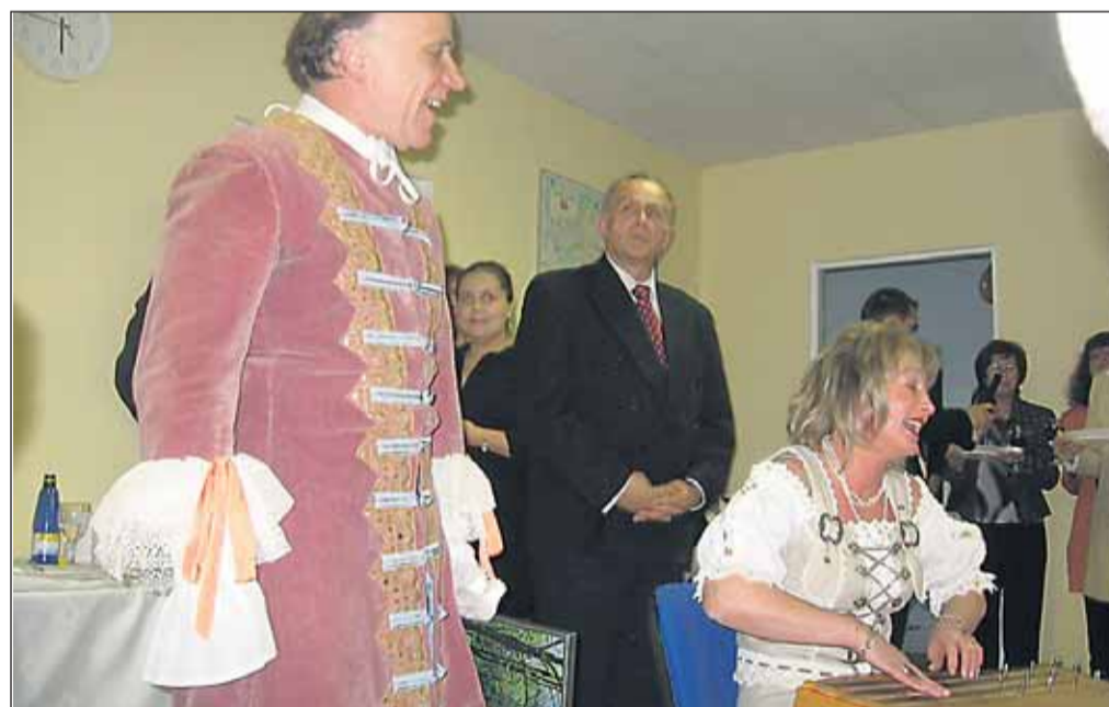
Mooste vallast saabusid külalised kostüümides ja lauluga