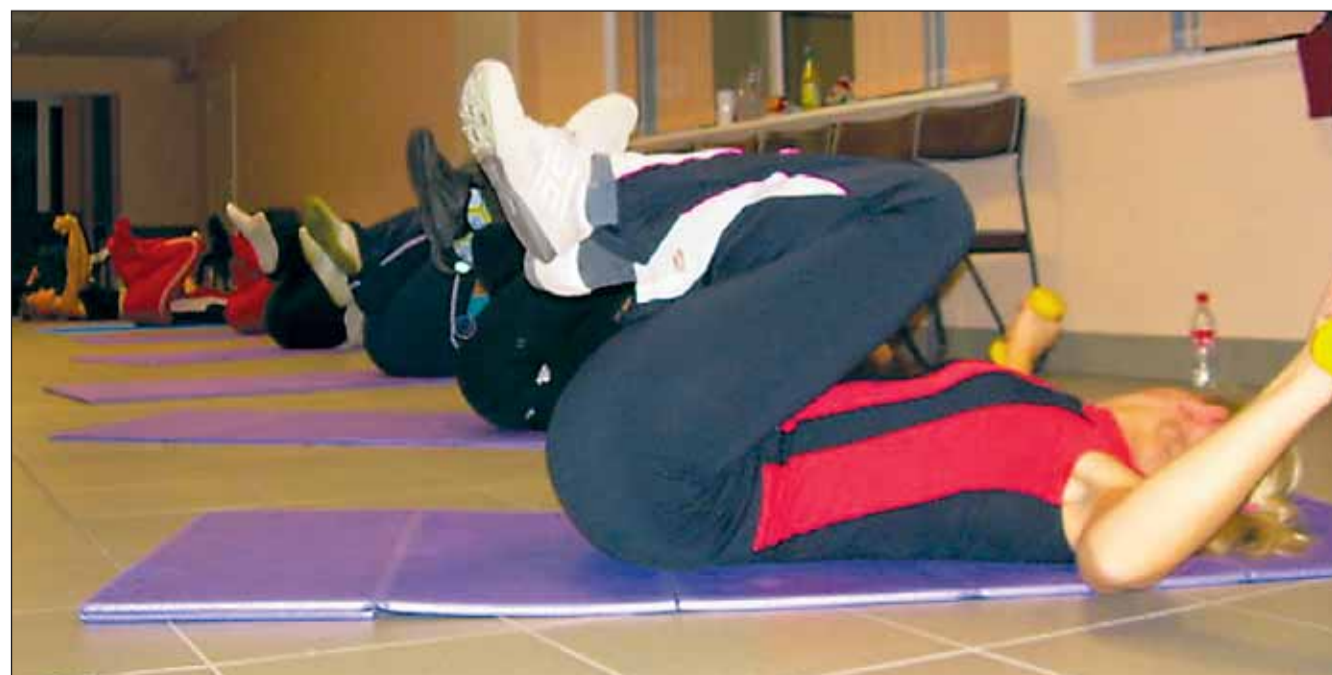
Vanamõisa naised seltsimajas trenni tegemas