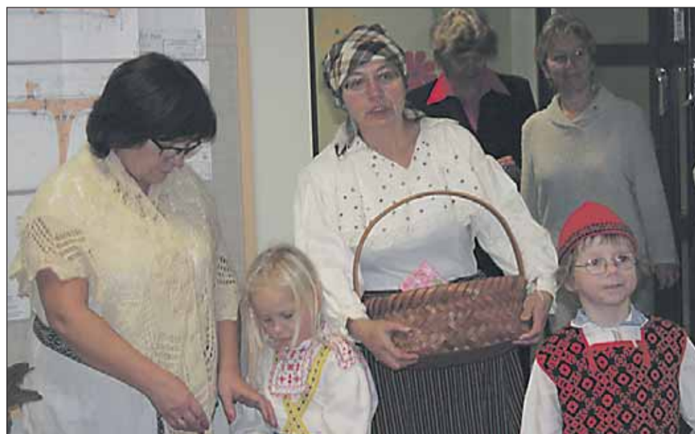
Laagri lasteaiad on tulnud õnnitlema kingikorviga