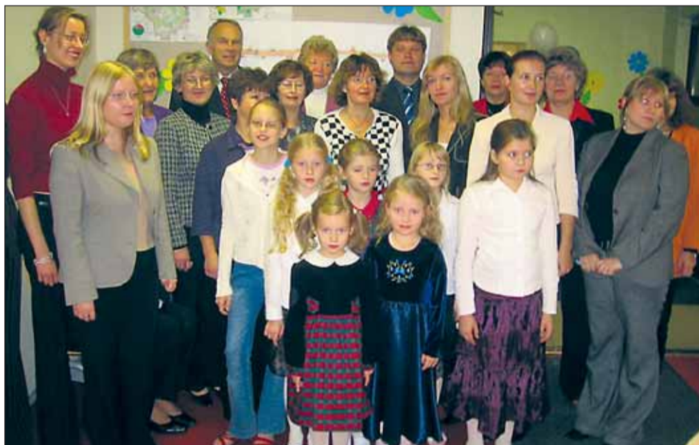
Ühispilt vallavalitsuse töötajate ja väikeste õnnitlejatega