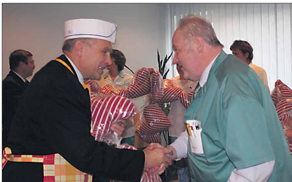
Sünnipäevatervitused meedikute perelt