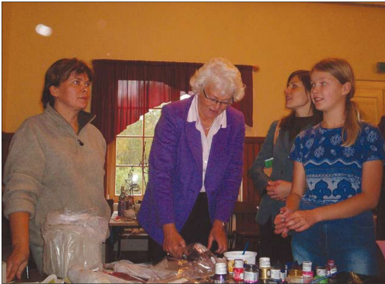
Keskel Euroopa põllumajandusvolinik Mariann Fischer Boel (lillas pintsakus) imetles Jõgisoo käsitöömeistrite tegemisi ja proovis ka ise kätt siiditrüki kujundamisel.