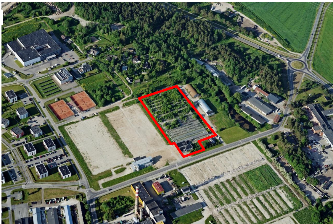
kaldaerofoto 17.06.2022