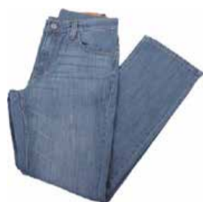
29. aprill - 1. mai Naiste ja meeste teksapüksid