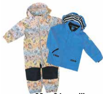
22. - 24. aprill Laste joped ja kombinesoonid