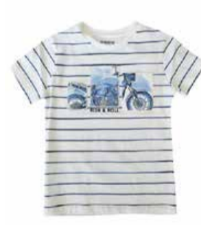
Laste T-särk Mayoral