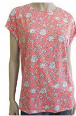
Naiste T-särk Fransa