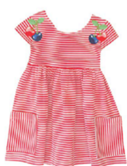
Laste kleit Mayoral