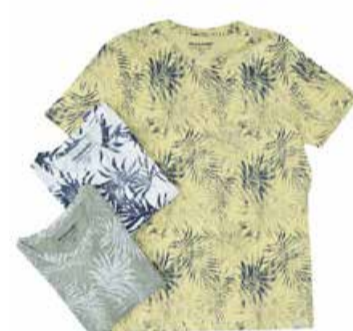
Meeste T-särk Jack&Jones