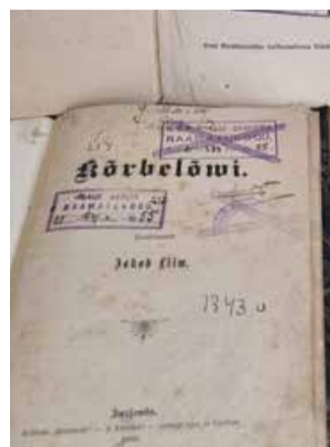
Näituse kõige vanem raamat pärineb aastast 1898. Selleks on Jakob Liivi Körbelövi