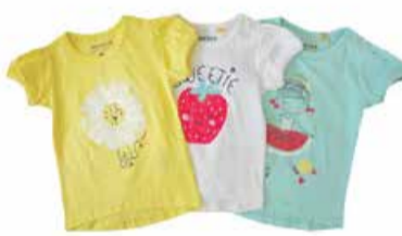
Laste T-särk Blue Seven