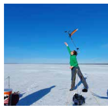
Nr 7 / aprill / 2022

Näitus on avatud vähemalt aprillikuu lõpuni.