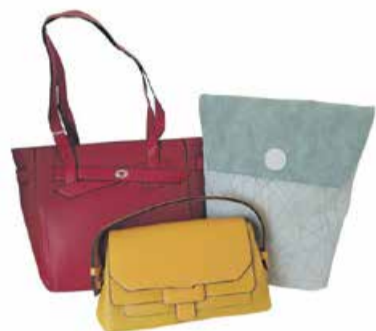
15. - 17. aprill Naiste käekotid