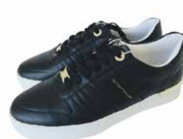
Naiste jalatsid Tom Tailor