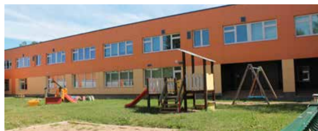
Selle koha peale tuleb lasteaia hoovi uus atraktsioon - kindluslõss

Rekonstrueerimise käigus rajatakse lastele oma