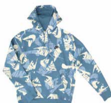
Meeste dressipluus Nike