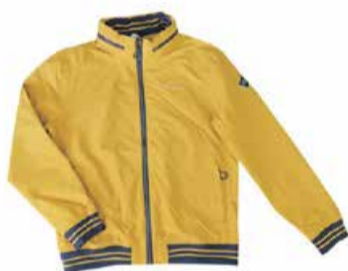
Meeste jope Crossfield