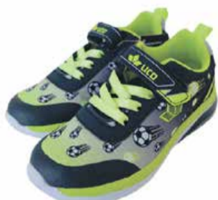
Laste vabaajajalatsid Lico