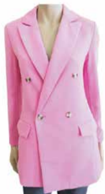
Naiste jakk Only