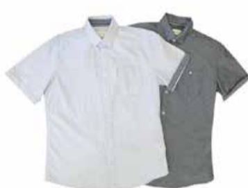
Meeste päevasärk Tom Tailor