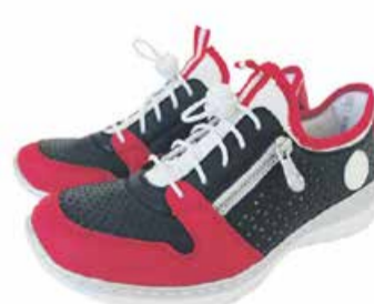
Naiste vabajajalatsid Rieker