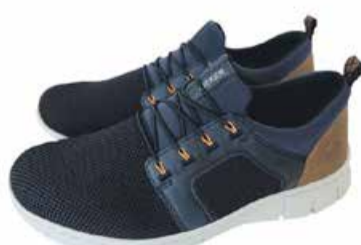
Meeste kingad Rieker