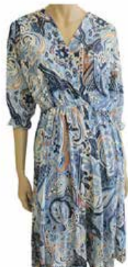
Naiste kleit Aija