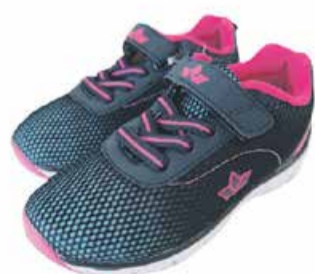
Laste vabaajajalatsid Lico