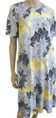
Naiste kleit Hailys