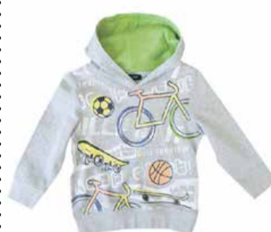
Laste dressipluus Blue Seven