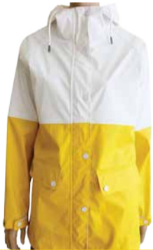
Naiste vihmajope Rukka