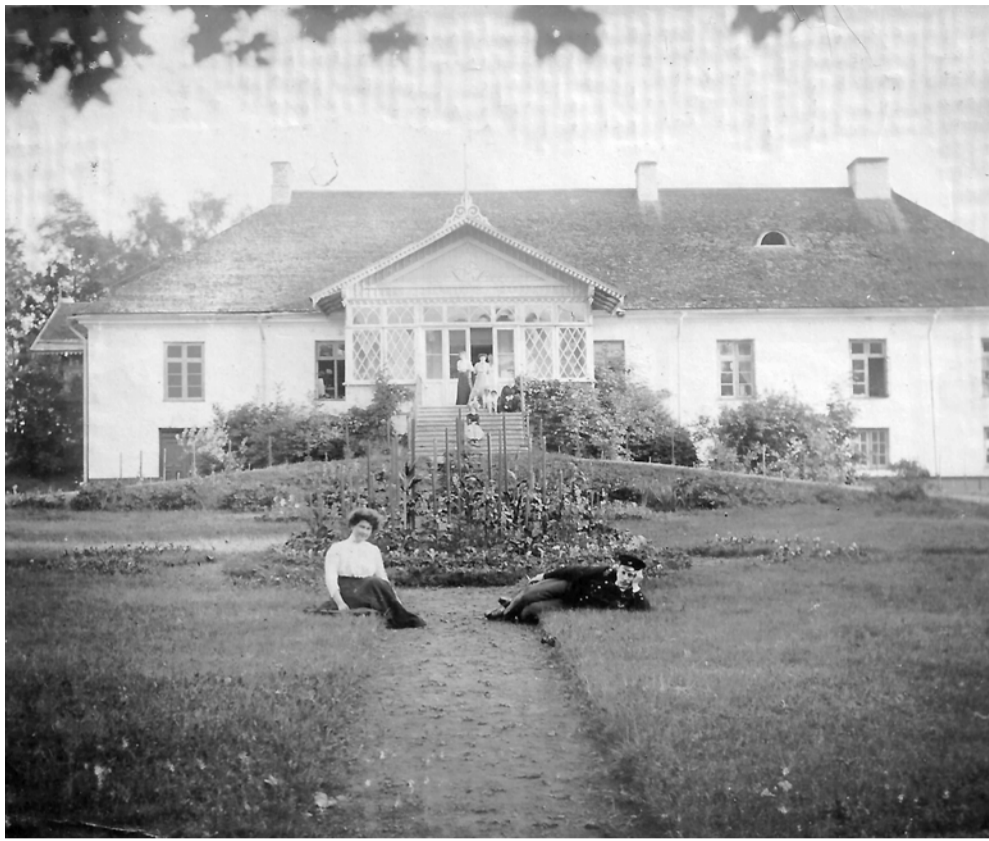
Ootamatud fotomälestused Haiba mõisast saadeti teele Poolast

Laste mängutoa plaanide avada sügiseks, sest plaanid, kuidas omavahel sidduda mängutuba ja ajalugu,