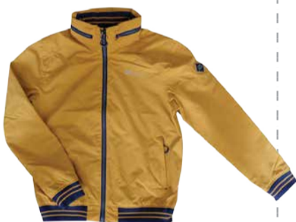
Meeste jope Crossfield