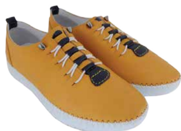
Naiste jalatsid Loretta Vitale