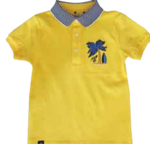
Laste polosärk Mayoral