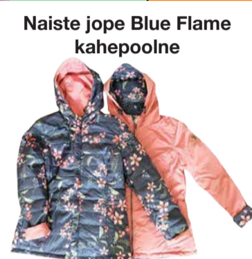
Naiste jope Blue Flame kahepoolne