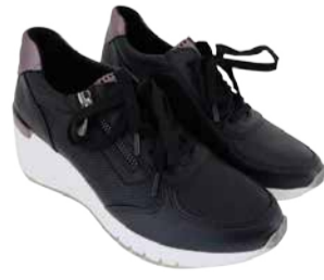
Naiste Jalatsid Marco Tozzi