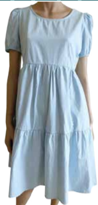
Naiste kleit M.X.O