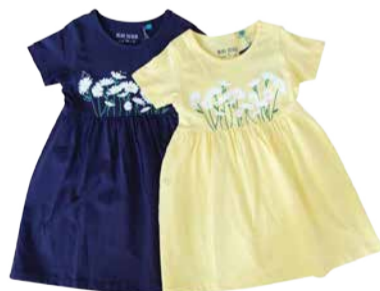
Laste kleit Blue Seven