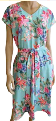
Naiste kleit Hansmark