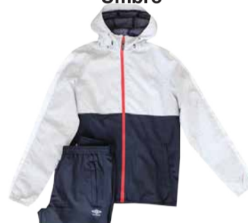
Meeste komplekt Umbro