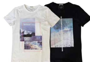
Meeste T-särk Tom Tailor