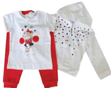
Laste komplekt Mayoral