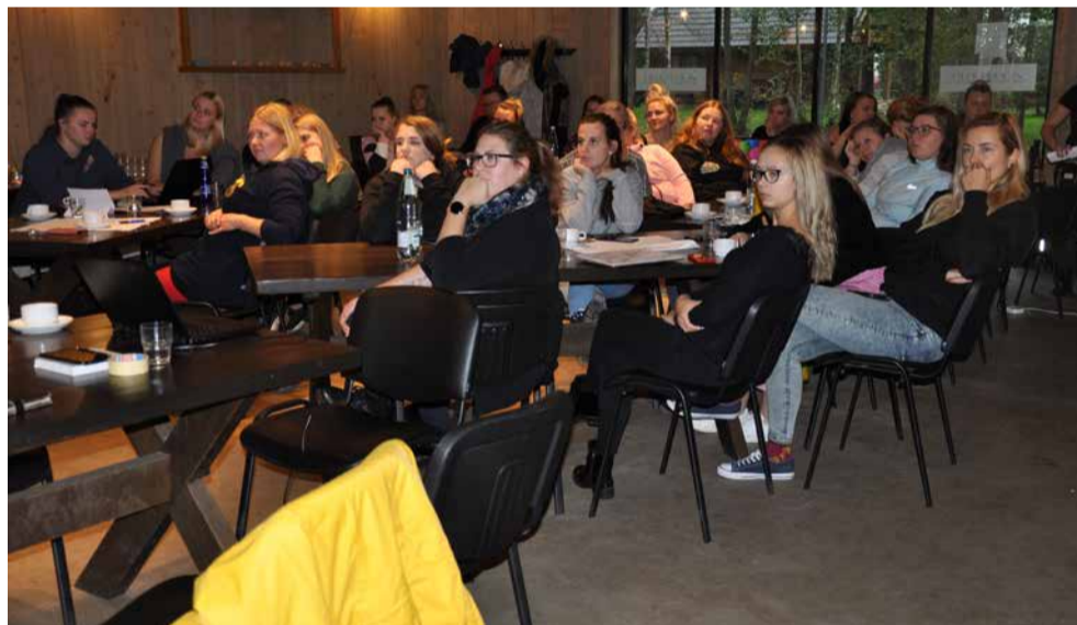
„Võrgustiku koostöö“ raames osales 60 noortega töötavat inimest erinevatel koolitustel

Projekti „Mänguriial ratastel“ raames toimusid