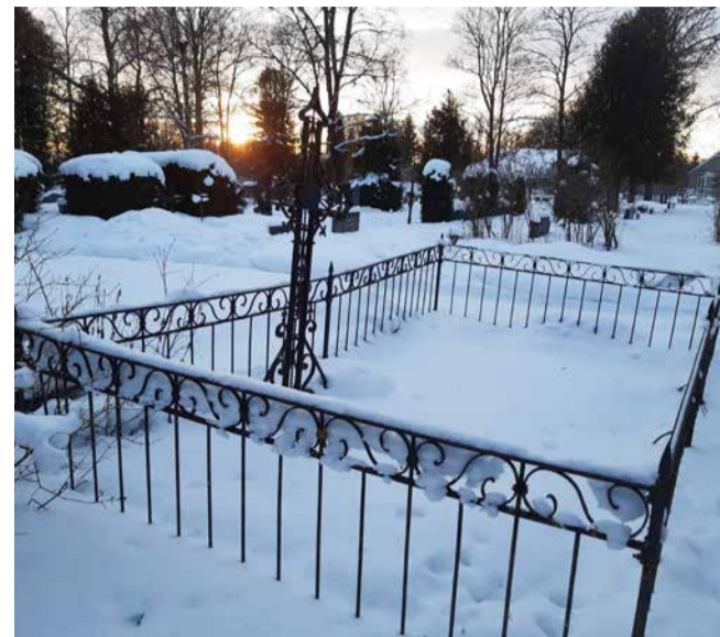
Nissi kalmistul on oma väike aiaga piiratud ja ristiga hauaplats, millele kevaditi lilledki istutatakse ja kus kalmistuvaht korda peab ning kuhu omasteta inimeste säilmed maetaksegi

Igatahes võib olla kindel, et kui inimene on jäänud oma elu lõpus päris üksi siia maailma, siis seisab vald hea selle eest, et viimane teekond oleks väärrikas ja lugu- pidav.