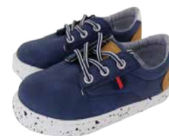
Poiste tennisid Happy Be