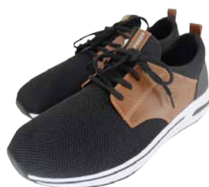
Meeste kingad Rieker