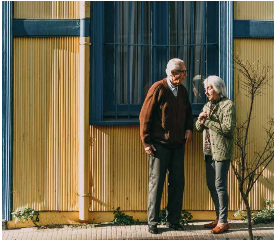
Planeeringu käigus selgub, kas krundile saab rajada lisaks hooldekodule ja päevahoju teenusele ka toetatud elamiseks sobivaid maju

Krundile on lubatud ehitada kuni 200 kohaga üldhooldekodu. Hoones saavad olema ühe- ja kaheinimese toad ja kõik igapäevaseks eluks va-