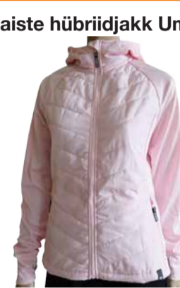
Naiste hübridjakk Umbro