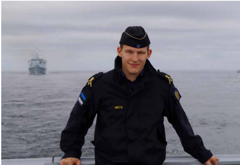
Ergo Mets sai veteranistaatuse juba kaitseväes teenistusülesandeid täites viga saades. Pärast seda on mees käinud kolmel välismissioonil

Kas selline mentaliteet oli õigustatud, ma ei oskagi öelda. Seda küll, et hilise-