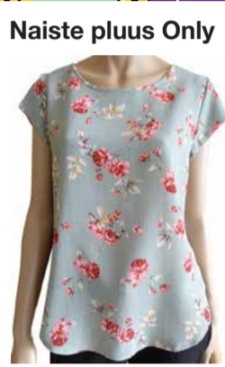
Naiste pluus Only