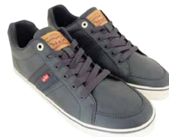
Meeste jalatsid Levi's