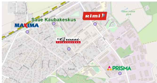
Linlasel on toidupoodide osas valikut

Rimi alustas juba mõeldud aastal uue kontseptsiooniga kaupluste väljaehitamist. Uuenenud poodides on lisaks tavakassadele ka iseteenindamise võimalus. „Oluline on ära märkida, et poodi tulevad keskkonnasäästlikud külmikud