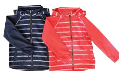
Laste softshell jope Outburst