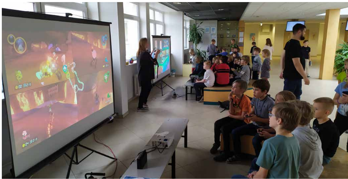
Projekti „Mänguriial ratastel“ raames toimusid noortekeskustes erinevate videomängude turniirid, mille käigus noored said oma e-spordi oskusi treenida