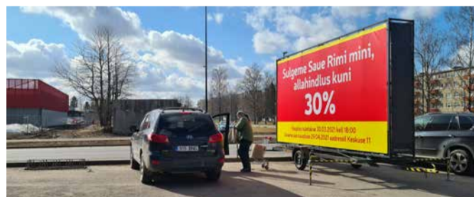
Rimi pisipood suleti märtsi lõpus, üle tee avatakse 29. aprillil suurem kauplus, kus on ligi 2000 erinevat toodet rohkem

ja CO 2 -l baseeruv külmasüsteem, mis kasutab ära külmasüsteemist tekkiva soojuse, et soojendada tarbevett ja kütta ruume. Lisaks saab pood ökonoomse LED-valgustuse,“ tutvustab Bats uusi suundi. Selliseid poode on Eestis valminud alla kümne.