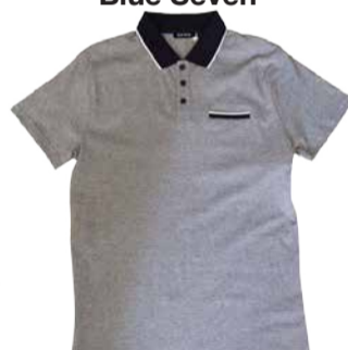
Meeste polosärk Blue Seven