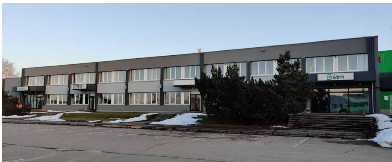
Saue raamatukogu 30 000 raamatut ja muud teavikut leiab uue ajutise kodu aadressil Tule põik 1

esimesena uue õppekorpus rajamine, siis keldrisse garderoobi rajamine, fuaje, söökla ja köögibloki rekonstrueerimine, kolmanda ja neljandana mõlemad õppekorpused tiivad ja lõpuks saali ja võimla pool,“ ütleb Kolks.