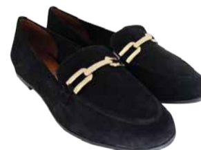
Naiste kingad Wortmann