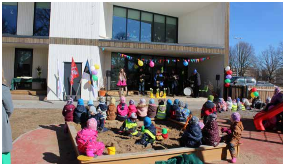
Sünnipäevapidu Nissi Trollide särtsaka kontserdi saatel.

Siin annavad tunde Nissi Trollid ja tegutseb bee-