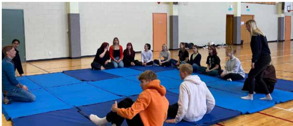
Emotsionaalse teadlikkuse ja vabastava hingamise töötuba.

Kahjuks ei ole meil veel koolimajas ruumi, kuhu kõik õpilased koos esine-