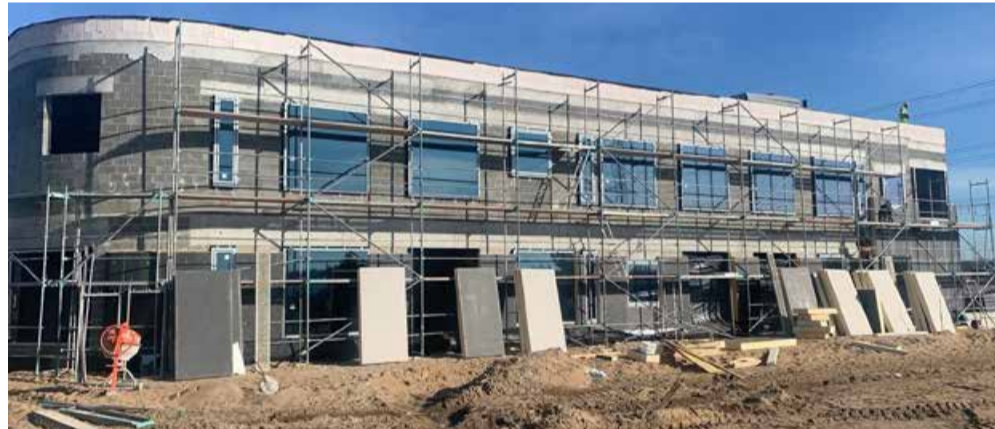
Kotka lasteaed Laagri aleviku külje all Alliku külas saab valmis 2022. aasta septembriks.

Projekt valmis Eesti Ehitusprojekt OÜ-s, arhitekt Keiu Albi.