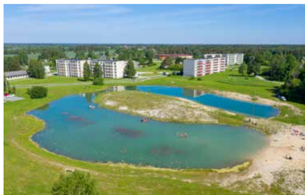
Soojadel ilmadel on Nissi tiik Riisiperes populaarne ujumiskoht, kuid läheb kiiresti sügavaks ja juba paari sammu pärast on väiksematel vesi üle pea.

Kõik veeohutusega seotud nõuanded ja info on koondatud lehele www.veeohutus.ee .