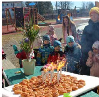
Tordi asemel olid hoopis värsked ja imemaitavad kaneelirullid.