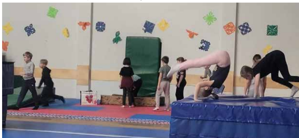
PartnerAcro pani laste kehalised võimed proovile.

jaid kuulama mahuks. Nii kasutasimegi ka sellel aastal tehnilise lahendusena Worksupi platvormi. Esimesi külalisi sai koos klassikaaslastega vaadata veebi vahendusel ja neile kirjaliikult küsimusi esitada.