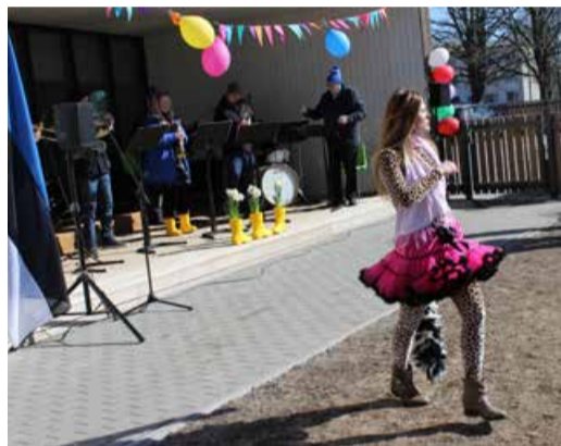
Peojuht leopard omas elemendis.

bikool. Seda kõike ja enda üritusi sai lasteaed korraldada ka koroonapiirangute ajal, sest uued ruumid on piisavalt suured, et neis hajatult paikneda.