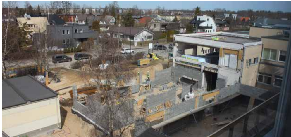
Algklasside kahekorruseline õppekorpus on ligikaudu 1200 m 2 suurune.

Kui koolihoone on täielikult renoveeritud, lähevad teisaldamisele maja ees olevad moodulklassid.