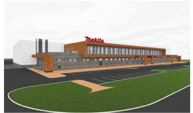
Makita Põhjamaade suurim esindus, mis koordineerib seadmete tarnet lisaks Eestile ka teistesse Baltikumi riikidesse - Läti ja Leetu - ning põhjamaadesse - Norrasse ja Rootsi - peaks valmima tuleva aasta kevad-suvel.

Just sel päeval, 21. aprillil, kui Saue valla lehe aprillilõpu number hommikul trükitist tuli, oli hoone ehitus jõudnud sannaani, et asetada sellele keskpäeval nurgakivi. Ajakapslisse jõudis tulevatele põlvedele kõige muu kõrval ka trükisoe Valdur.