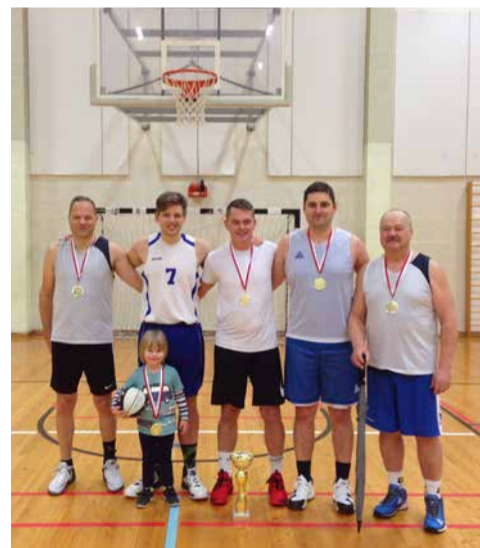
Meistritiitel jagamisele: vasakul Saue Ettevõtjate Liit, paremal Laagri RSK Kuuse 2

Tegemist on võimlemis- ja jõulinnakuga, mis rajati Eesti Olümpiakomitee ja Coca-Cola ühiskonkursi „Liikumine teeb erksaks“ toel, konkursile esitas taotluse Saue Spordikeskus. Projekti ellukutsujate eesmärk oli rajada üle Eesti liikumislinnakuid, mida saaksid vabalt kasutada kõik huvilised üksi, pere või sõpradega. Kokku rajati üle Eesti 12 välijõusaali ja teiste seas on nüüd uus sportimiskoht ka Saue linnas Sarapikus. Võimlemis- ja jõulinnak on lihtsa ülesehitusega, aga võimaldab teha erinevaid harjutusi: keretõsteid, kõhulihase- ja venitusharjutusi