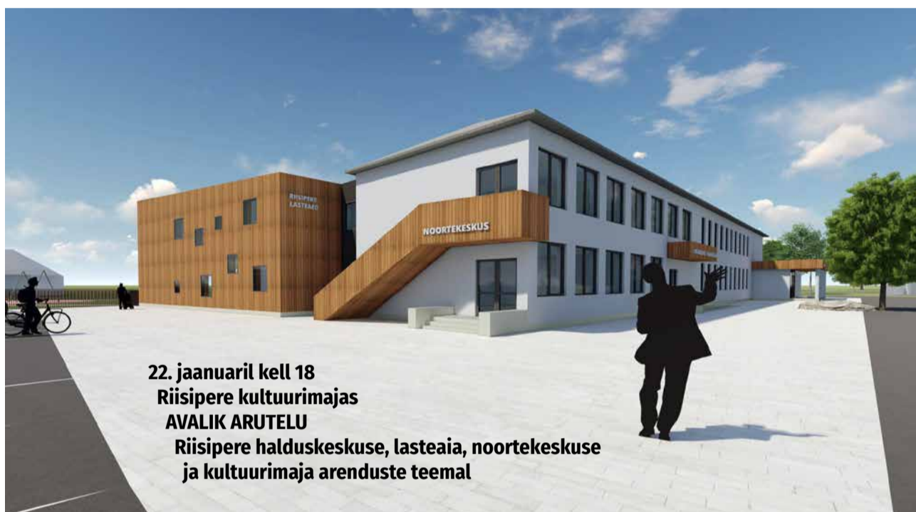
22. jaanuaril kell 18 Riisiperre kultuurimajas AVALIK ARUTELU Riisiperre halduskeskuse, lasteaia, noortekeskuse ja kultuurimaja arenduste teemal

Praegune raamatukogu laieneb endise volikogu saali alale, millest kujun-