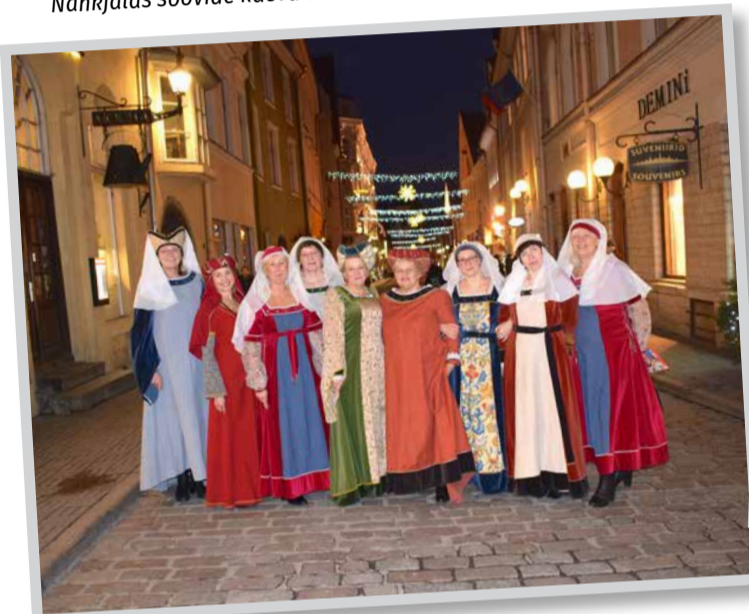
Saue valla raamatukogude aastalõpuüritus toimus piduehtes pealinna ja keskajastiilis: linnaemandatena ja arhailisi jõulukombeid ja -toite nautides (Lia Nirk)