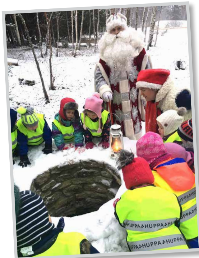
Turba lasteaias Buratino rühm Jõuluvana Kusti juures Nahkjalas soovide kaevu ääres (Tiina Umbsaar)

Euroapteek tegutseb Saue oma rohpooiga Maxima kaupluse hoones.