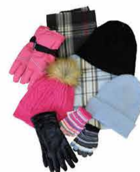
Mütsid, sallid, kindad