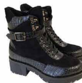
Naiste saapad Scandi