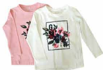
Laste T-särk Name it