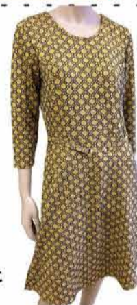
Naiste kleit M.X.O