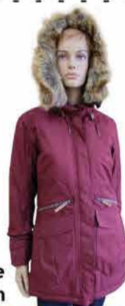
Naiste jope Five season