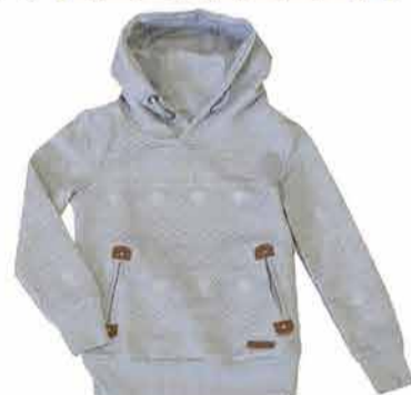
Laste dressipluus Hailys