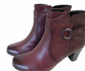
Naiste saapad Jana