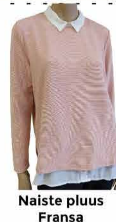
Naiste plus Fransa