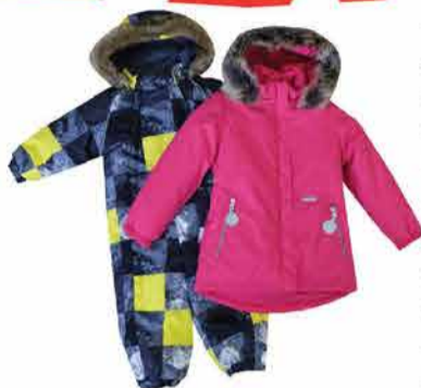
Laste joped, kombinesoonid