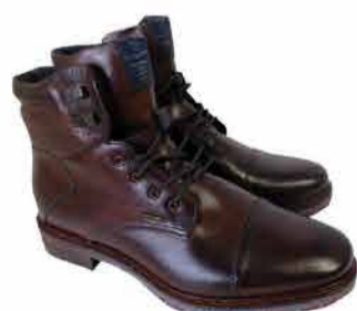
Meeste saapad Bugatti