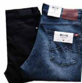
Naiste ja meeste teksapüksid