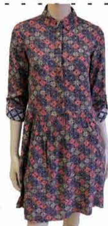
Naiste kleit Fransa