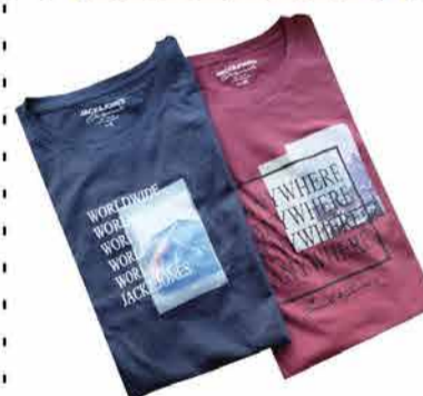
Meeste T-särk Jack&Jones