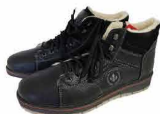
Meeste saapad Rieker