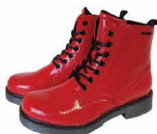
Naiste saapad Tom Tailor