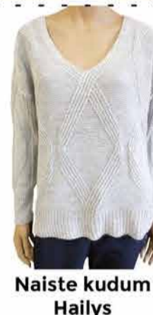
Naiste kudum Hailys