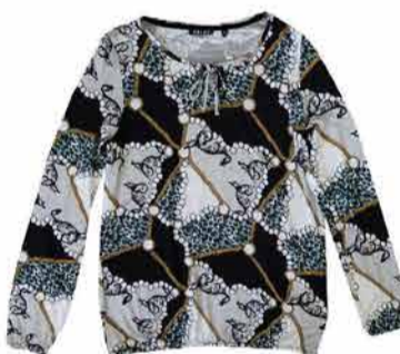
Naiste topp Blue Seven