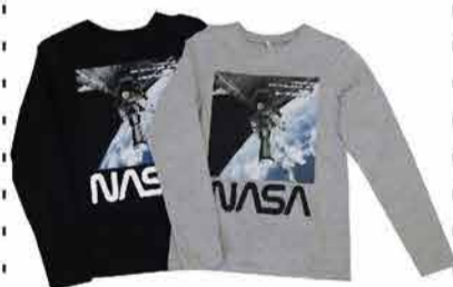
Laste T-särk Name it