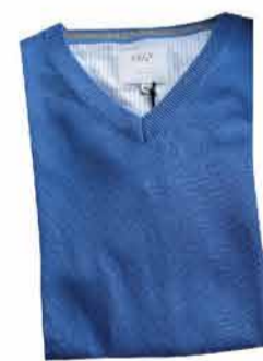
Meeste kudum Erla