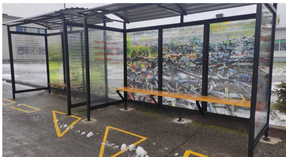
Mõnes peatuses on vastavalt ootajate hulga n-õ topelpaviljon

Nüüd on vallamajas koostamise 2021. aasta bussiootepaviljonide nimekiri. Kui kuskil on silma jäänud asukohti, kus on piisav kasutajate hulk või ei ole olemasoleva paviljoni suurus kasutatavast arvustades piisav, võib sellest vallavalitsusele teada anda aadressil teed@sauevald.ee. Ei saa eeldada, et selle teate peale kohe paviljon paigaldatakse, aga peatuskoha kasutuskorras tehakse selgeks ja siis otsustatakse, kuidas edasi.