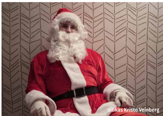
allikas Kristo Veinberg

Haiba lasteaias on selline komme, et iga jõulu eel viivad väikesed päkapikud metsa loomade ja lindudele toitu. Mets on ehitatud küünaldega, mis näitavad punaste mütsidega seltskonnale teed lõkkeplatsile. Kõigepealt toidetakse loomi, kaunistatakse puud õunte ja porganditega ning lindudele puistatakse mättale seemneid. Seejärel loetakse-laudakse mõni jõululaul ja mängitakse liikumismäng. Kõige lõpuks saavad ka lapsed midagi magusat – pärispäkapikud on jätnud lastele tänutäheks tehtud töö eest korvitaie suhkrujõhvikaid ja sokolaa-diseenekesi.