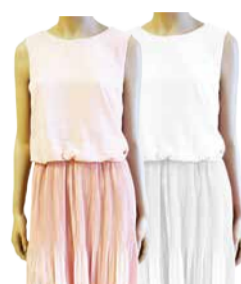
Naiste kleit VERO MODA