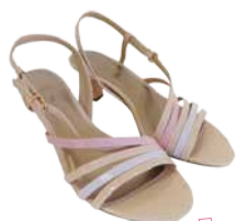
Naiste kingad TAMARIS

26.- 28. juuli Adidas, Nike, Umbro, Puma spordiriided ja -jalatsid -30%