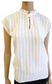
Naiste plus B.YOUNG