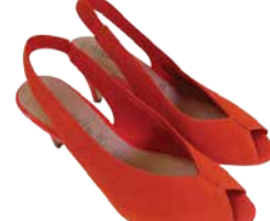
Naiste kingad TAMARIS