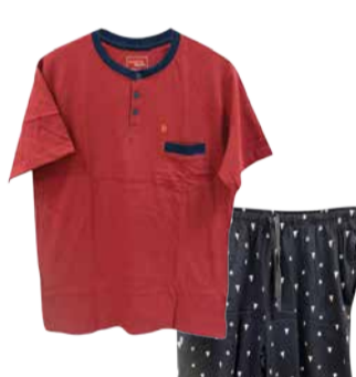
Meeste öopesu DODO