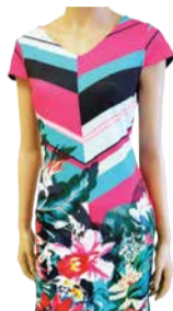
Naiste kleit SMASHED LEMON