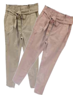
Naiste püksid VERO MODA