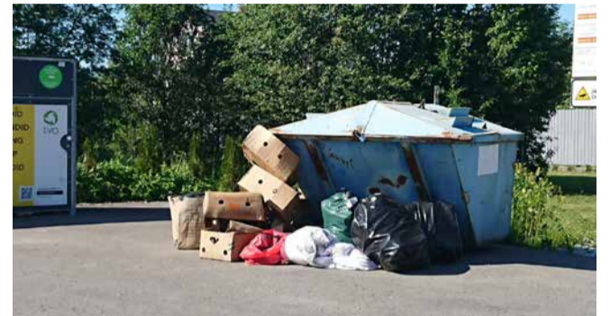
Vaatepilt Vatsla külas