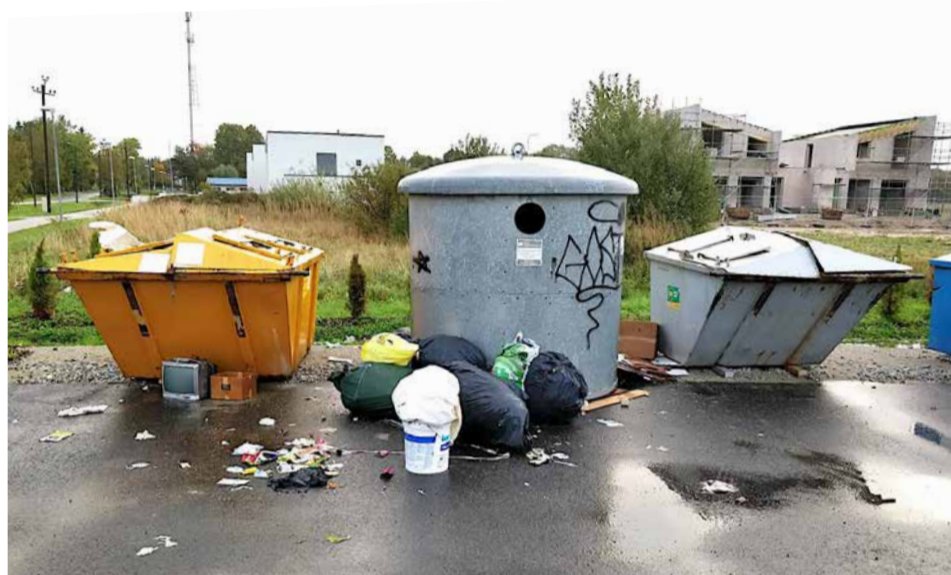
Vaatepilt Alliku külas

Teine kole koht on Alliku külas Kotka tee ääres.