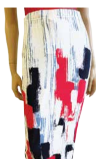
Naiste seelik KULPA COLLECTION