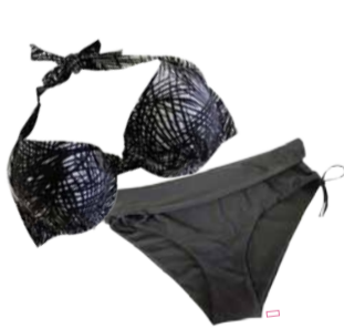
Naiste rannariided ADELAIDE