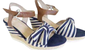
Naiste kingad MARCO TOZZI