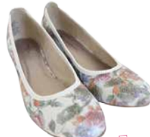
Naiste kingad TAMARIS