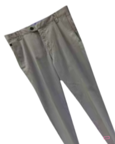
Meeste püksid ERLA OF SWEDEN