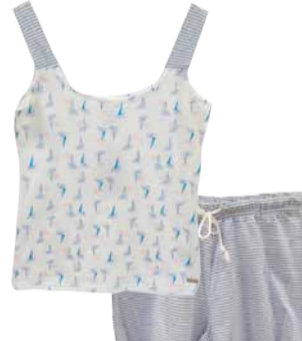
Naiste öopesu DODO