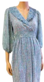
Naiste kleit VERO MODA