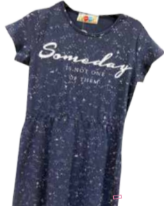
Laste kleit NÖÖP