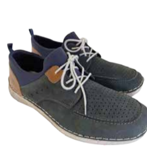
Meeste kingad RIEKER