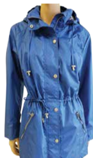
Naiste jope VALINO