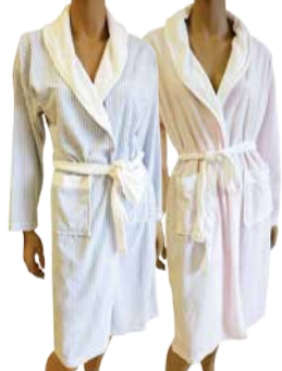
Naiste hommikumantel MARY WHITE

19.- 21. juuli Naiste rannariided kummimadratsid basseinid -30%