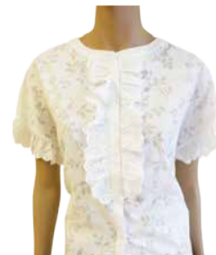
NAISTE plus FRANSA