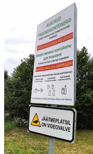
Prügistajad on ka Välja piirkonnas Vanamõisa külas tegutsemas