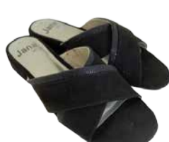
Naiste kingad JANA