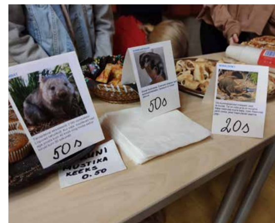
20 ja 50 sendi kaupa kogunes märkimisväärne summa, 1127 eurot.