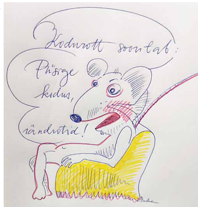
Autor: Eneken Maripuu

Mõni aeg pärast kooli olin EKA ettevalmistuskursuste joonistusõpetaja, tõsi, seal küll loomi suurt ei joo-