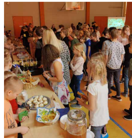
Fotod: Reelika Väiti