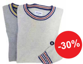
Meeste kudum JACK&JONES (2värv)