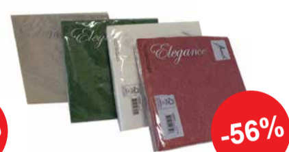
Salvrätik AMBIENTE Elegance 33x33cm 15tk pakis