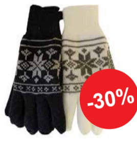
Naiste kindad 4HANDS