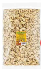
India päkel 1kg NÄKS NÄKS