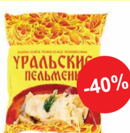
Külmutatud pelmeenid lihaga "URALSKIE PELMENI" VICI 1kg