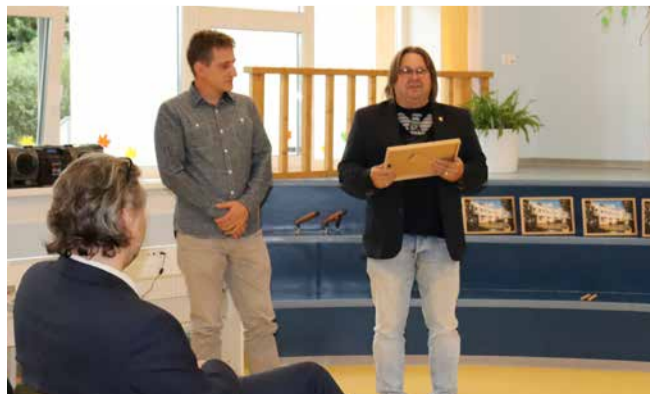
Tekst ja foto: Tuleviku lasteaia

Ka läbis suvel uuenduskuuri lasteaia mänguväljak, kus liivaala oli pea kahekordistunud. Appi tulid vabatahtlikud Laagri Lionsi-klubist, kes ühe poole mänguväljakust liivavabaks tegid - viisid liiva ära, tasandasid pinnase, tõid uue mulla ning külvasid muru. Teatpulk anti üle Saue vallavarahaldusele, kes ülejäänud mänguväljaku liivavabaks muutis. Nüüd on mänguväljakul liiv vaid liivakastis ning kiikede ja ronilatte all kummimattidest turvaalad. Uuendamistööd võeti kokku väikse tänuaktusega.