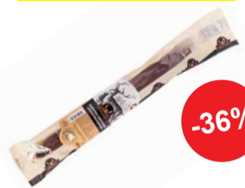
Täissuitsu hirvevorst lepasuitsujuustuga 230g LINNAMÄE