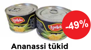
Ananassi tükid kerges siirupis 225g LORADO