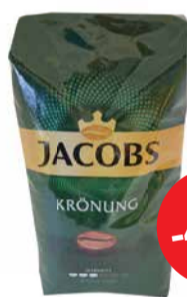
Kohviuba JACOBS KRÖNUNG 1kg