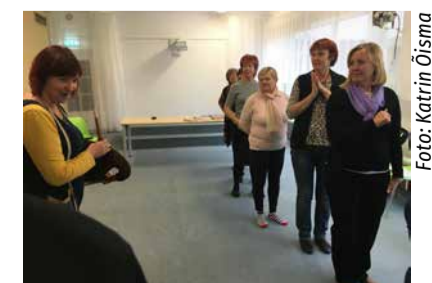
Riisipere lasteaia õpetajatele tuletati santimiskombestikku meelde

Mardipäev – 10. november. Kadripäev – 25. november.