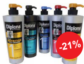
Šampoon; palsam DIPLONA 600ml