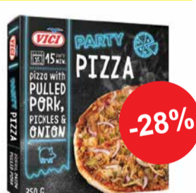
Pizza Party rebitud sealihaga VICI 350g