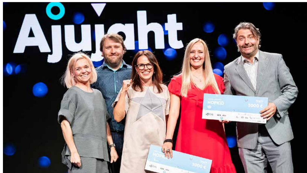
Saue vald toetab „Ajujaht“, sest see ideekonkurss on pinnas, kus ettevõtluspisik saab levida. Eelmisel hooajal valisid sauevallalad rahvahääletusel oma lemmikuks HopKidi

Meil on asjad nii üles ehitatud, et programmidega tegeleb tugiüksus ja pigem oleme traditsiooniliste lahenduste peal. Tõsi, hiljuti viisime vallaelanikeni ühe Soome päritolu kommunikatsiooniäpi, mis on veel kasutusel kolmes Eesti omavalitsuses: Järva vallas, Elva vallas ja Hiiu maal. Meie lähtusime loogikast, et noorem vallaelanik ei saa enam infot tingimata arvutist, vaid pigem nutitelefoni. Facebook ei kata aga kõiki vajadusi infokanalina ära. Meie tänane fookus ei ole põhialuste muutmine, vaid selliste tööriistade kasutusele võtmine, millega saame valla teenused elanikule lähemale tuua.