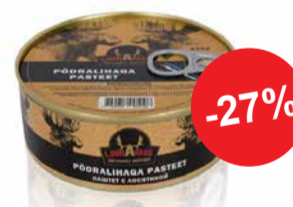
Konserv pödralihaga pasteet 240g LINNAMÄE