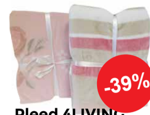
Pleed 4LIVING (Roosa; triibuline) 127x152cm