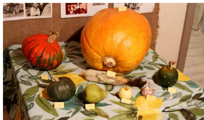
Fotod ja lugu: Marje Sulharov

Mõõduvõtmise parim söök oli seenepirukas ja ainus kraadideta jook kodune viinamarjamahl. Õhtu jooksul istusid laua taha käesurujad ja saali põrandal harrastati „golfi“. Oli ka neid, kes tulid selleks, et vaadata oma vana armast koolimaja ja meenutada möödunud.