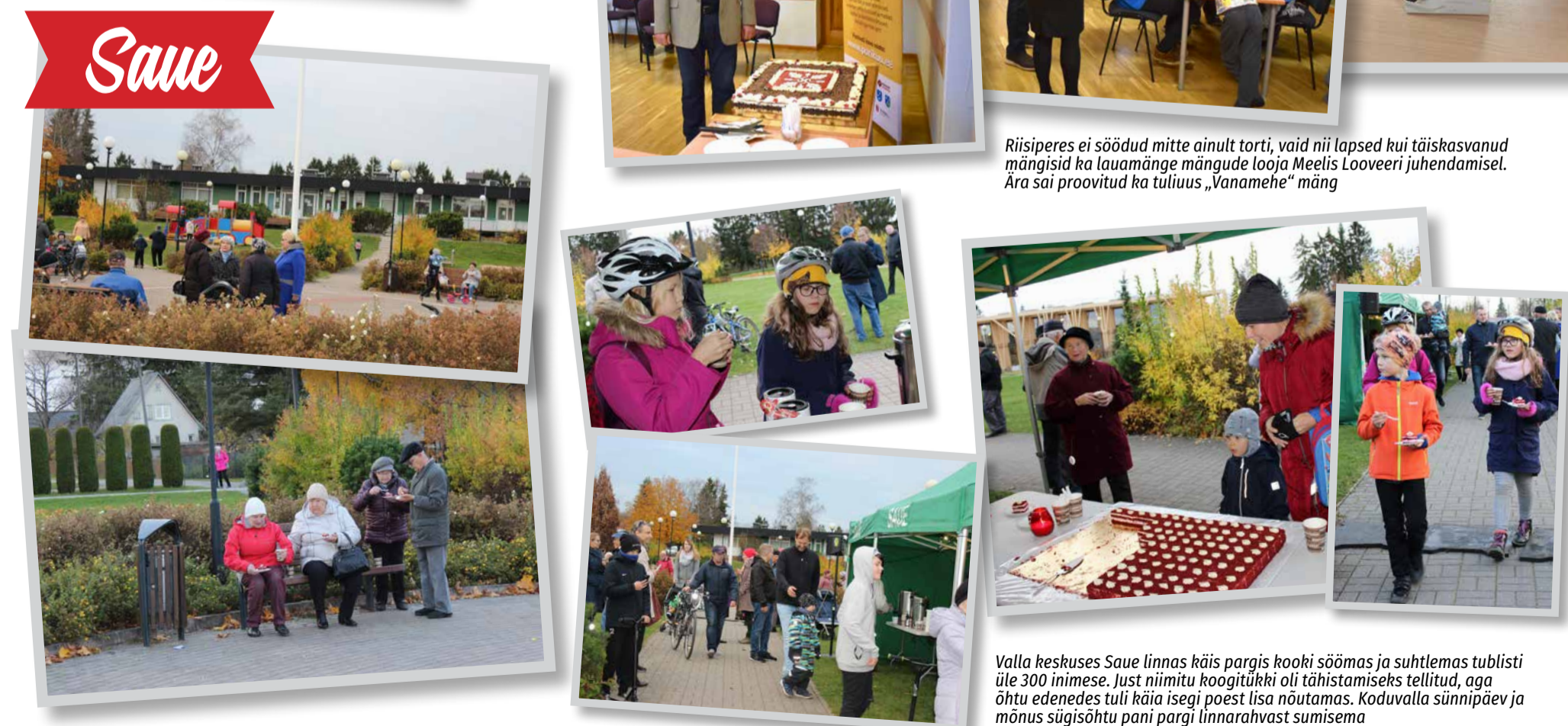
Valla keskses Saue linnas käis pargis kooki söömas ja suhtlemas tublisti üle 300 inimese. Just niimitu kooGITÜKKI oli tähistamiseks tellitud, aga õhtu edenedes tuli käia isegi poest lisa nõutamas. Koduvalla sünnipäev ja mõnus sügisõhtu pani pargi linnarahvast sumisema