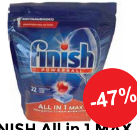
FINISH All in 1 MAX nõudepesumasina tabletid 22tk