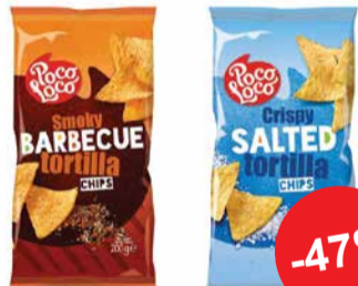
Tortilla sipsid POCOLOCO - BBQ - Soolaga