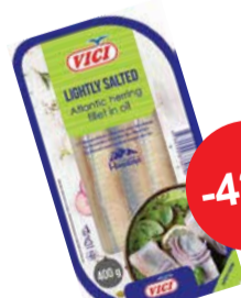
Heeringafilee kergsoola ölis 400g VICI