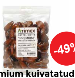
Premium kuivatatud dattel kivita 300g ARIMEX