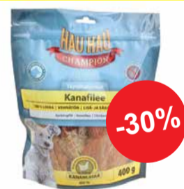
Koortele HAU HAU CHAMPION delikatess kanafilee 400g