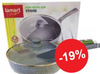
Pann 28cm kaanega LAMART