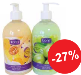
Vedelseep LORIN 500ml