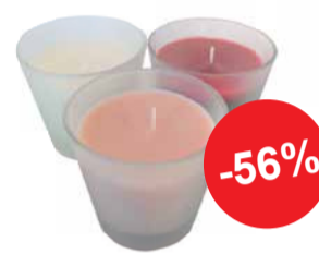
Küünal topsis FANNIK