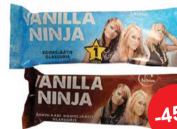
Vanilla Ninja jäätis 110ml - Vanilli - Šokolaadi