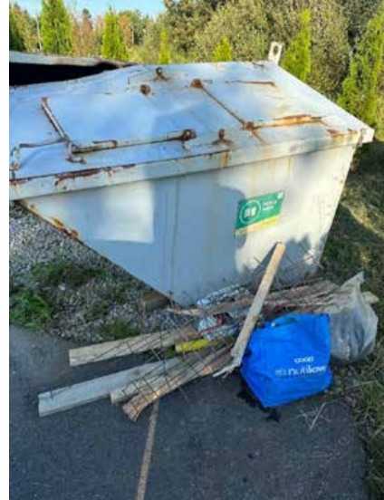
Kotka ja Kauri tee paberi ja papi konteinerist leitud kraam.

vanapaber (kodumajapidamises tekkiv papp ja paber); plastid (plastikkanistrid, plastkarbid, kausid jm majapidamises tekkiv plastikust ese); lehtklaas (akna- ja kasvuhooneklaas, oluline, et raamideta); klaaspakend ja segapakend (pudelid, purgid, konservekarbid - kõik see, mis on millegi ümber, sh penoplast, mis on nt uue televiisori ümber); tekstiil (vanad rõivad, kangad, riidest esemed, mis ei ole taaskasutusseks, vaid kasutuskõlbmatud); vanaõli, värvid, lakid, liimid ja vaigud; ravimid ja jäätmed, mida nakkusohu vältimiseks peab eraldi ko-