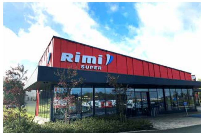
Kaupluses on pinda 927 m 2 .

Kauplus on avatud iga päev kell 8.00 kuni 22.00.