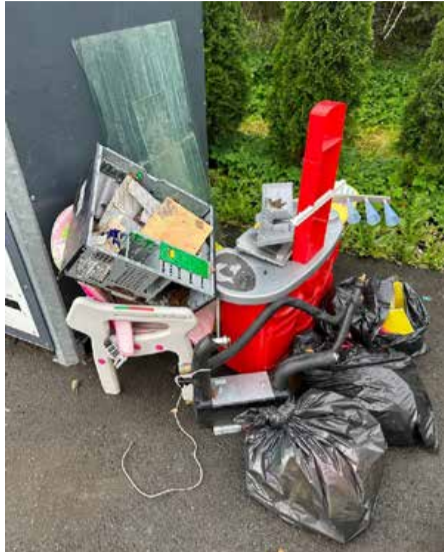
Vatsla pakendipunktis on alatasa probleemeid.

Saue linna jäätmeplats: ohtlikud jäätmed, elektroonikaromud, vanareh-