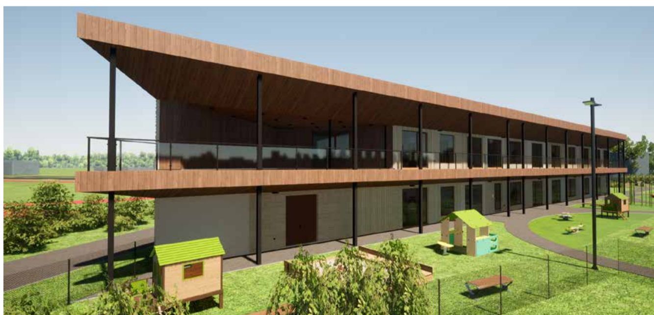
↑ Maja hoovipoolne lõunakülg pika rõdu ja varikatusega jätab avatud ja õhulise mulje.

Fuajee külgnev koridor esimesel korrusel jaotab lapsed edasi rühmaruumidesse. Hoovipoolse avanevad trepi-kojad on ainult laste õue ja tuppa tulekuks ning evaku-