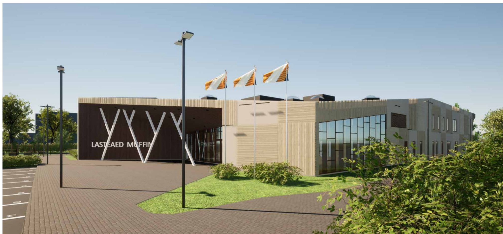
Uue lasteaiahoone fassaad avaneb Tule põik tänavale.