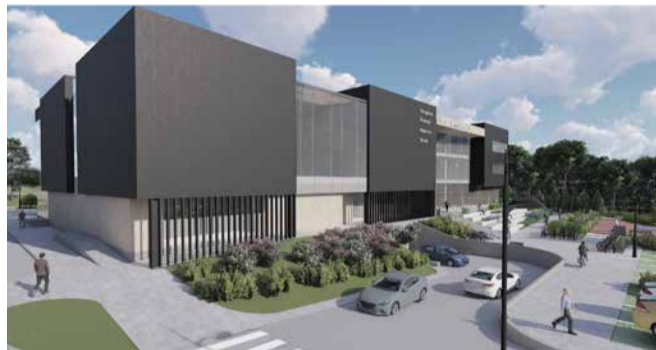
Mõldre elamusmaja eskiisprojekt Instituudi tee 134, Alliku küla.

maatulundusmaa 100%) kinnistu ja lähiala detailplaneeringu.