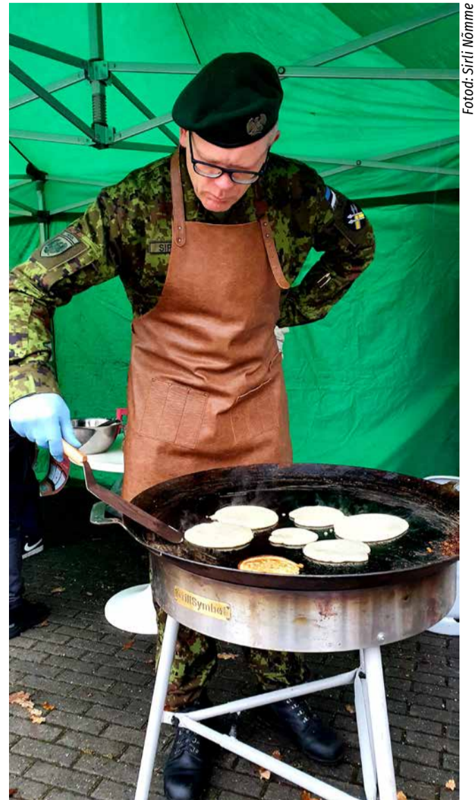
Naiskodukaitse pannkoogikohvikusse lahkete inimeste jäetud 206 eurot annetati Eesti Pagulasabile.