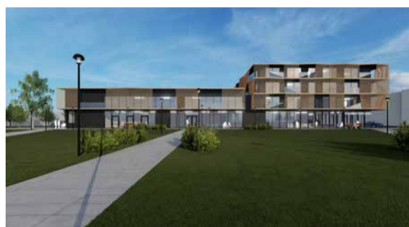
Hoone fassaad avaneb Keskuse parki.

tulle mitte varem kui on Eesti majandus ja 2023. aastal, kuid kõik milline turusituatsioon, sõltub, millises seisus sest uue hoone ehitus