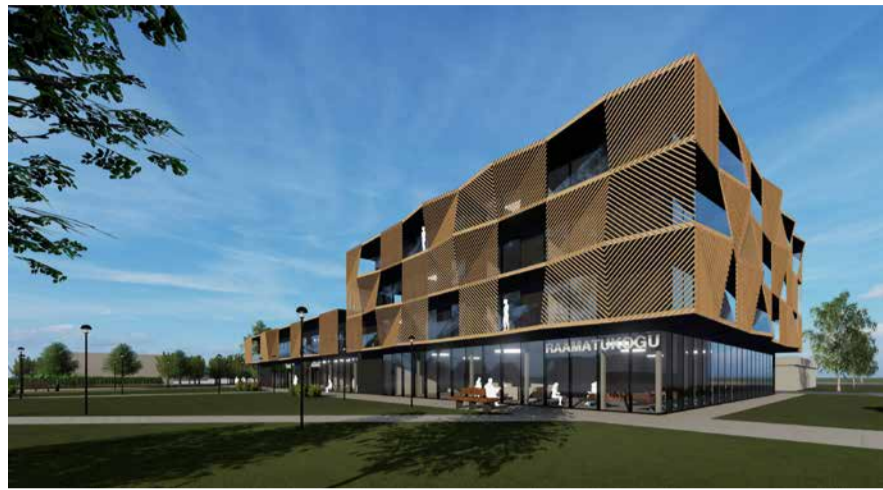
Kütise tänava poolt on hoone nelja-, eramute poolt kahekorruseline.