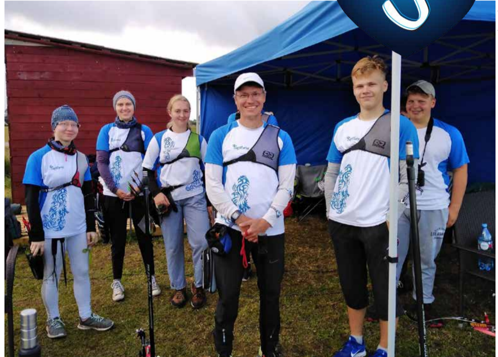
Klubi laskjad meistrivõistlustel.

Pikkvibu on traditsiooniline, keskajast tänapäeva üle tulnud vibuliik. Sellele üsnägi lähedane on vaistuvibu, sihiku ja lisadeta vastukaare vibu, mida võib üsnägi sageli filmides näha - näiteks „Näljamängud“. Tippspordi mõttes on kõige kaasajemad sport- ja plokkvibu, millel on sihikud ja hulk vidinaid küljes selleks, et nooled