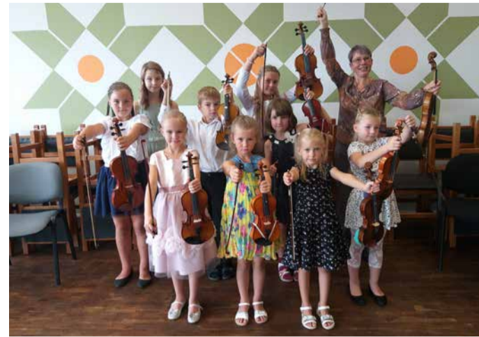
Muusikakooli viiulimängijad Suzuki suvelaagris Vana Vigalas.

Lisaks pingsale pillimängule külastasid orkestrandid Kehtna kuulsat piimafarmi,