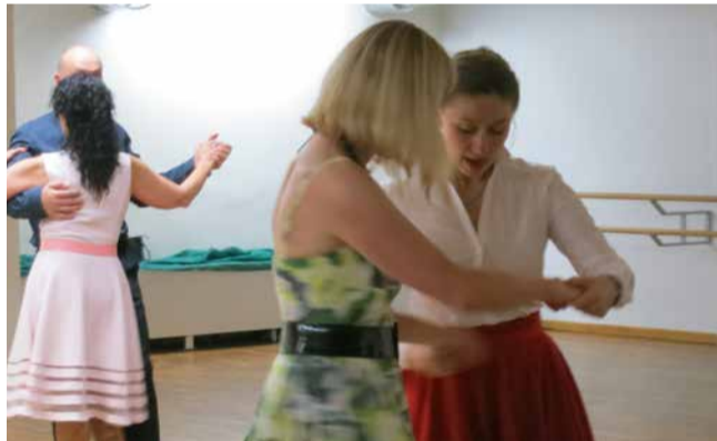
Kõik huvilised on oodatud Riisiperre seltskonnatantsu tundi.

erksa ja uuringud näitavad, et tants on üks nendest tegevustest, mis aitab ennetada dementsust.