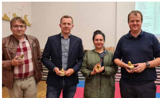
Viimases Pingis - mälumängusarja võitjad

Sarja üldarvestuses suutis liidrikoha hoida ja eelmise hooaja üldvõitu kaitsta Viimases Pingis, kes viie