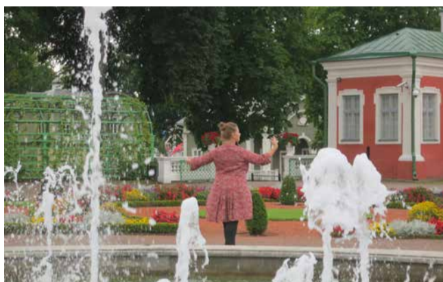
Barokktants sobib ideaalselt kehahoiuga tegelemiseks, nii hoidmiseks kui parandamiseks.