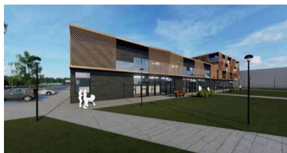
Läbi kahe korruse ulatuv saal on hoone madalamas osas.