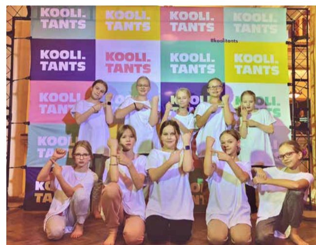
MyDance tantsuklubi Saue valla esindusgrupp SVEA1.