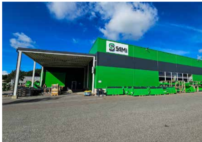
Sami tootmishoone Saue.

Hoone ei süttinud tootmisprotsessi tulemusel. “Kui tulekahju tekkepõhjusega tegeleb Päästeamet, sai meie hinnangul põleng alguse ehitustöödest, mida teostas hanke korras palgatud ehitustevõtte,” rääkis