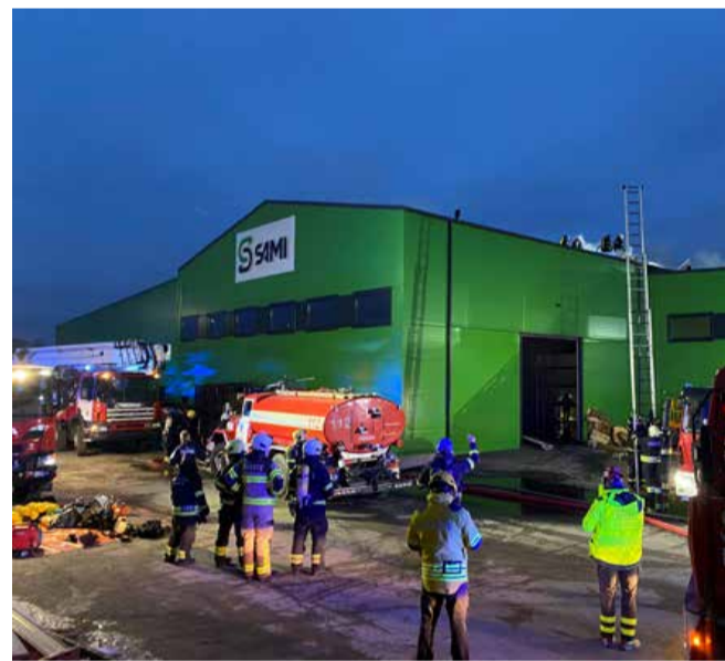
Fotod: Sami Grupp, Päästeamet